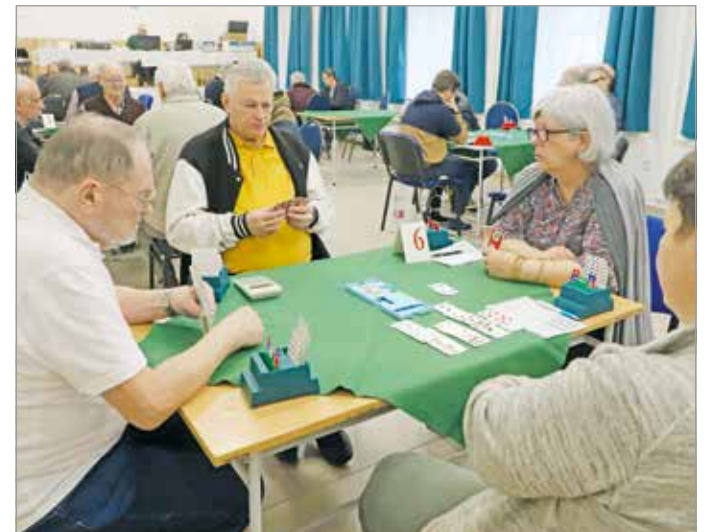
Népszerű a miskolciak körében is a bridzs.