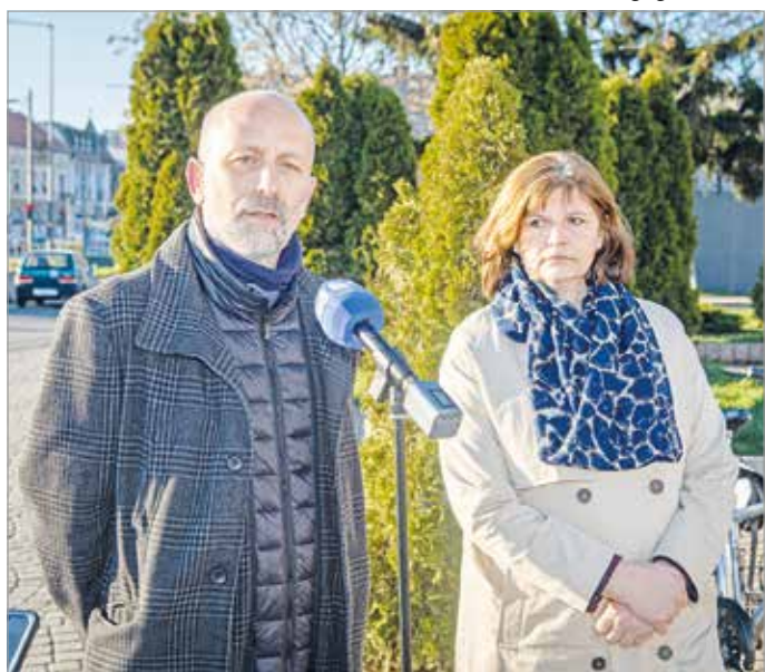
Stílusosan, Miskolc legforgalmasabb csomópontján, a Búza térnél volt sajtótájékoztató.

A közelgő esemény beharangozó sajtótájékoztatóját március 28-án stílusosan, Miskolc talán