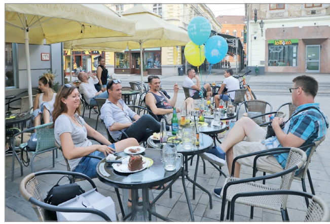
A cél az, hogy jó legyen a miskolciak közérzete.