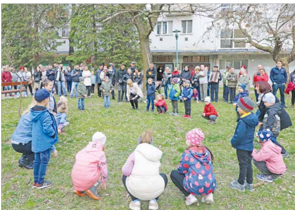
Szükség lesz további támogatásra is.

– A környéken nincs művelődési ház, sem pedig közösségi tér, ahol összejöhetnének a városrészen élők. Ezt a hiányt szeretnének pótolni – fogalmazott az egyesület elnöke, emlékeztetve: a kollektív tagjai tavaly május hónap leforgása alatt mintegy hétszáz ezer forintot gyűjtöttek össze, ami bizakodásra adhat okot a mostani, „Adj egy ötöst!” szlogenel indított kampányt illetően