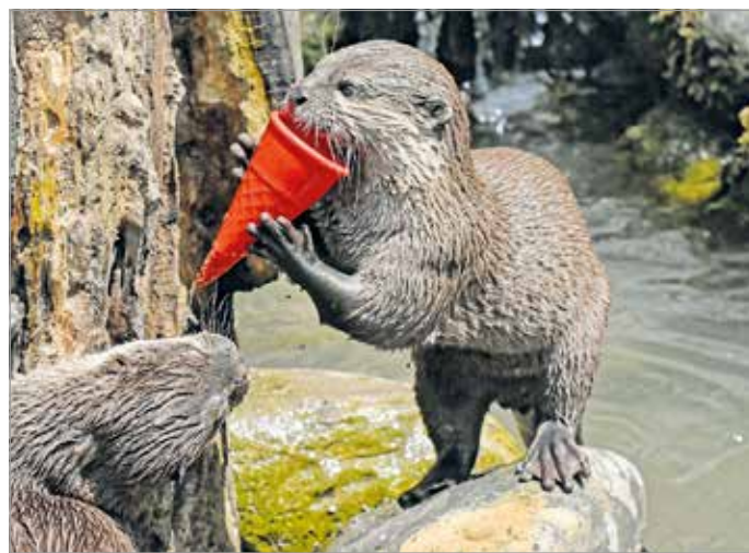
A vidra tényleg szereti a vizet, de nem a Szinvába való