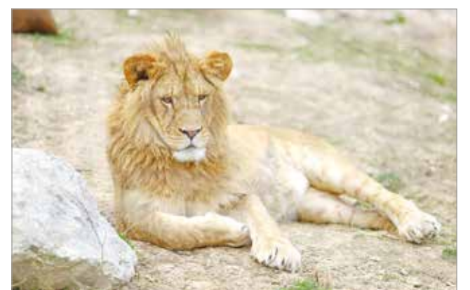
A három új oroszán egyike.