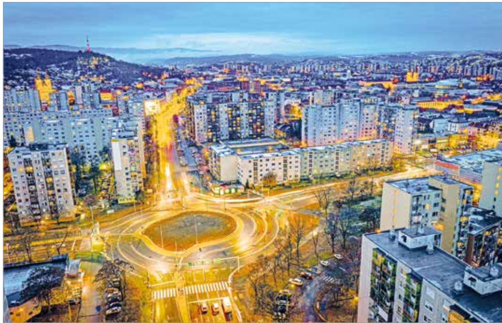
Légifelvételünk a turbókörforgalom premierjén készült.