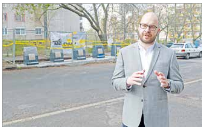
Szarka Dénes.