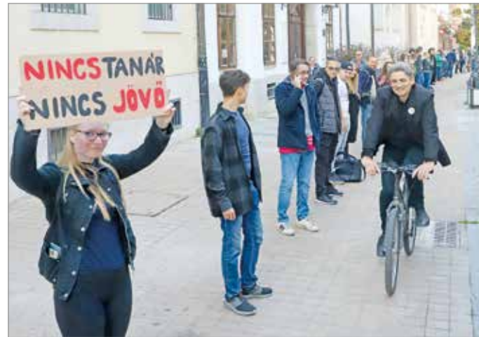
Mi lesz a pedagógusok státuszával?

A státusztorvényként elhíresült tervezet ellen aláírásgyűjtés indult, ehhez már 3000-nél is több pedagógus csatlakozott. A szignójukkal azt vetítik elő-