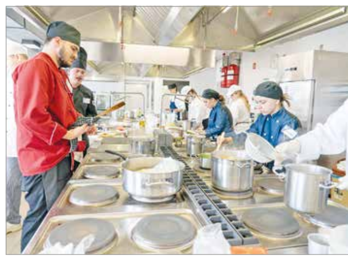
A Szentpáli iskola tanulói kiválóan szerepeltek a versenyen

taniuk. Ezen kívül 1-1 palack pezsgőt kellett kitölteniük 7-7 pohárba egyenlő mennyiségben, egyszeri rátöltési lehetőséggel úgy, hogy az üvegben nem maradhatott pezsgő. A csapatok egy csapatvezetőből és öt tanulóból álltak: két pincér, két szakács és egy cukrász, akik az elődöntőben elért