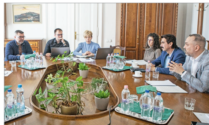
Egyeztető megbeszélés a városházán.

– A fórumon szóba került, hogy a Nagyavass felső soron található, több tíz köbméternyi szemét elszállítására már kértünk árajánlatot, az önkormányzat dolgozik a problémán. Következő fogadóóránkon már konkrétumokkal tudunk szolgálni ezzel kapcsolatban.