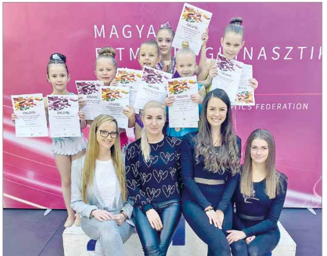
Kiválóan szerepeltek a DVTK-s RG-s lányok a tavaszi elődöntőn.

„A célunk, hogy minél többen jussanak fel az első osztályba. Most is van ilyen sportolónk, a többiek zömmel másod- és harmadosztályban versenyeznek vagy szabadidő-sportolók. Utóbbiakat is szívesen látjuk, nem kell mindenkinek versenyeznie, ezért nincs elvárás vagy ideális alkat, amelylyel el lehet kezdeni ezt a sportot, bárki jöhet. Nem árt egy kis rugalmasság, de itt megtanulnak mindent, a tartásjavítástól a versenyzésig. Ez a legnőiesebb sportág, amely jó alapot ad mindenhez az életben a sportolás te-