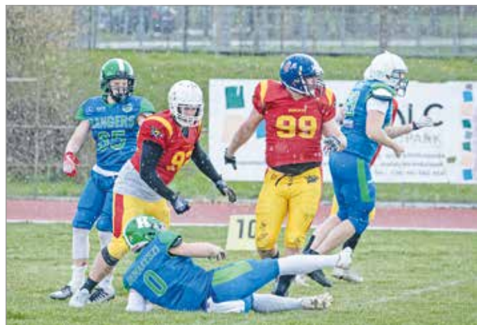
A viharos időjárás sem ártott a hazaiaknak.

Pontszerzők: Nagy Donát (elkapott touchdown Győrki Ferenc passzából), Jónás Máté (field goal)