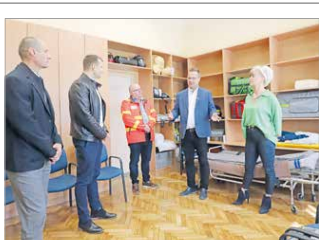
Az ünnepélyes átadás pillanata.