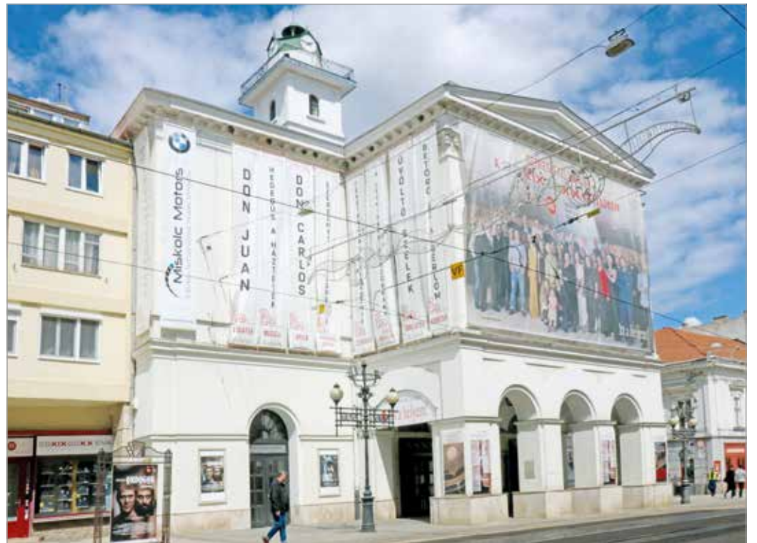
Színvonalas programsorozattal ünnepeli a Miskolci Nemzeti Színház fennállása 200-adi évfordulóját.

„A fesztiválok sora ezzel azonban nem ér véget” – jelentette ki Fedor Vilmos tovább sorolva a programokat.