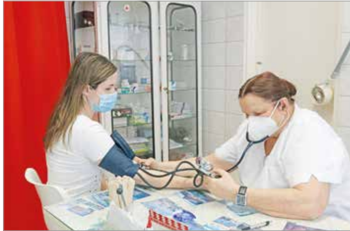
A háziorvosok sokat tesznek egészségünk megőrzéséért.

„Minden egészségügyi eszköz, műszer és gyógyszer rendelkezésre áll” a Borsod-Abaúj-Zemplén vármegyei telephelyeken az Országos Mentőszolgálat (OMSZ) által április 1-jén kiadott közlemény szerint. Azt is írták, hogy a múlt hét végéig ügyeletre 217 háziorvos és 53 házi gyermekorvos jelentkezett, így „a működés személyi feltételei is biztosítottak”.