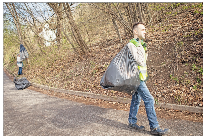
Szemétszedés Perecesen.

Serbán Zolt szemétszedési akciói tavasszal is folytatónak: április 29-én Bükkzentkereszen, május 6-án, a Borangolást megelőzően pedig a Nagyavason gyűjtik a mások által „otthagyt” hulladékokat.