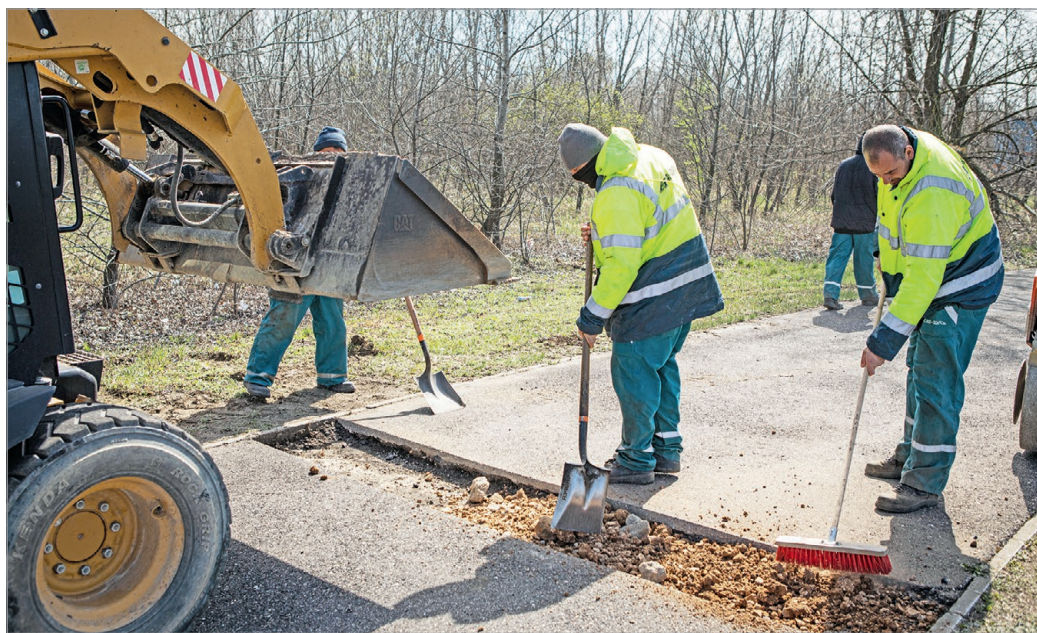
Felsőzsolca felé is bővül a kerékpárút-hálózat.

Kerékpáros nyomot alakítottak ki a Kondor Béla utcában,