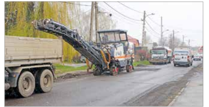
Dolgoznak a munkagépek.