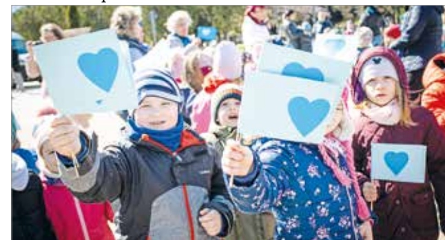
Mindenki másképp egyforma.