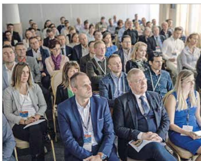
A rendezvénysorozat második állomása Miskolc.

Az elmúlt évek történései, így az orosz-ukrán háború, az infláció és az energiaválság kockázata komoly következményekkel járt a gazdaságokban. A magyar vállalkozások sincsenek könnyű helyzetben, napról napra újabb kihívásokkal kell szembenézniük. A Portfolio és a KAVOSZ országos rendezvénysorozatán szakemberek segítségével gyűjtik egy csokorba a legfontosabb, kkv-kat érintő információkat. Szó lesz a finanszírozási és fejlesztési lehetőségekről, a gazdasági kilátásokról, és hogy mégis hogyan lehet megőrizni