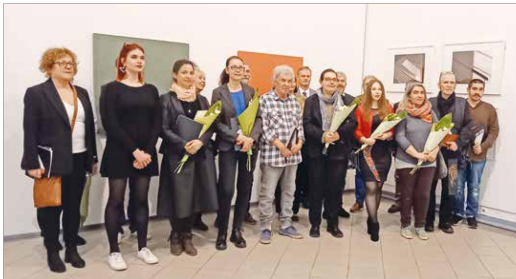
A 26. Miskolci Téli Tárlat díjazottjai, valamint díjalapítói.