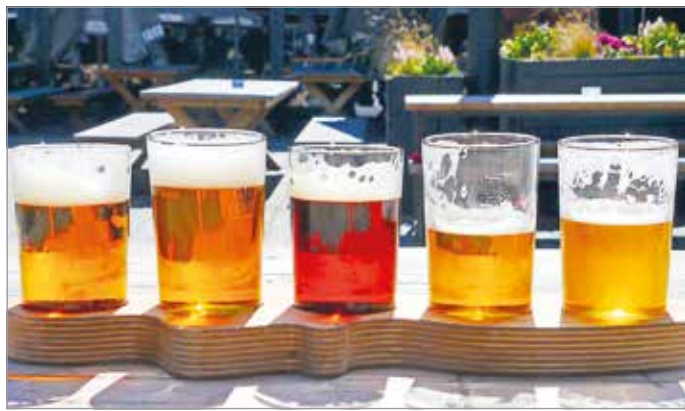
Előbb-utóbb üresen maradnak a poharak

Bár a borsodfogyasztásnak hazánkban hagyománya van, sörből iszunk nagyobb mennyiséget. A 15 éves és annál idősebb magyarok heti átlagos sörfogyasztása 2,6 liter