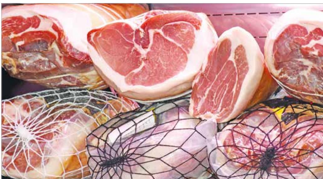
A magyarok nemzeti húsvéti eledele a sonka

zott, pácolt és előfőzött tarjáig mindenféle variációt találunk. A kiválasztott hústerméket érdemes egy éjszakára hideg vízbe tenni, így kiázik belőle a túl sok só, és hamarabb is megfő másnap. Arra azonban figyeljünk, még ha a Bíró Ica-Schober Norbi-Rubint Réka szentháromság felszentelt főpapjai is vagyunk, hogy a zsíros réteget ne távolítsuk el a sonkáról! Az a kis csík ugyanis megakadályozza, hogy a hús kiszáradjon főzéskor. A sonkát lassan főzzük, nem szabad forrnia a víznek. A főzőleves megáztatathatunk néhány füstölt kolbászt is, csak az ízharmónia végett. A visszamaradt levet ne öntsük ki, mivel több húsvéti íz van benne, mint egy ünnepi főzőműsorban! Tegyük el, később pedig kiváló lehet káposztás ételekhez öntve, bableves alapjának vagy lencse gazdagításához.