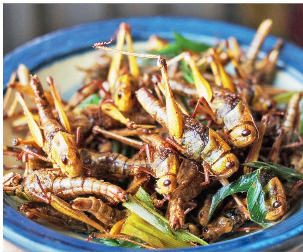
Magyarországon emelkedett a rovarfogyasztástól elzárkózók aránya

Az emberek döntő többségének nem jön be, hogy tücsököt-bogarat egyen. Mivel a napokban a tücsökfagyi kapcsán újra a médiafigyelem középpontjába került a rovar-és téma, a Nébih igyekezett