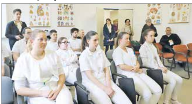
Szerették volna megtudni, hogy teljesítenek stresszhelyzetben.