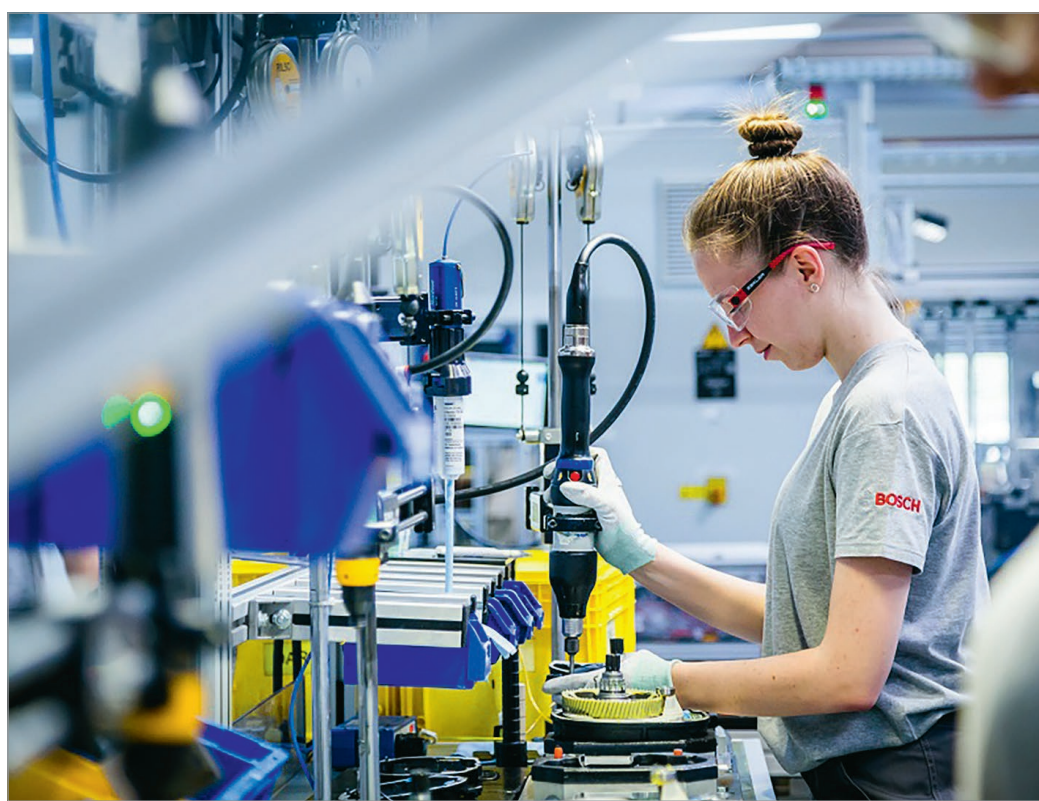
Mindennapos életkép a Boschból

– Több gyártó cégnél kisebb-nagyobb mértékű létszámleépítést hajtottak végre az utóbbi hetekben, hónapok-