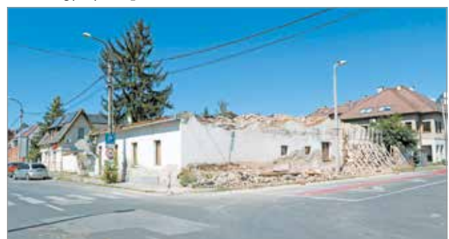
A Nagy Lajos király utcai épület torzja.