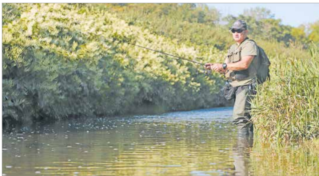
A Szinván azért nem lehet kifogni rekordméretű amúrt.

Most a horgászok többségének ez a sport arról szól, hogy minél nagyobb halakat csével-