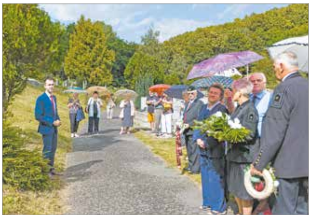
Perecesi bányásznapi ünnepség.