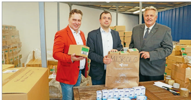
Folytatódik a LED-csere-program.

A program második, most indult szakaszában 2023. szeptember 30-ig lehet regisztrálni.