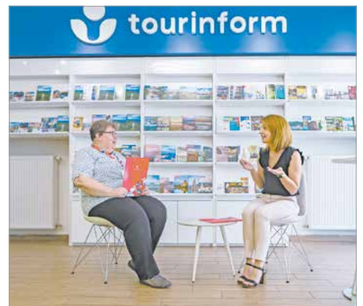
Ismét az ország legjobbjai közé kerültek.

Az irodák teljesítményét nemcsak egymáshoz, hanem az országos átlaghoz is viszonyítják. Átlag fölötti az éves megkeresések száma (az adott időszakban több mint 14 ezer ügyfelet szolgált ki a mis-