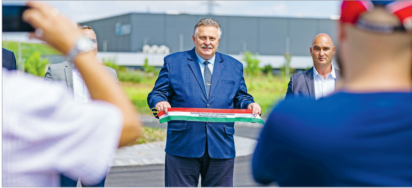
A Déli Ipari Park egyik beruházási átadási ünnepsége.

– Meggyőző számukra az, amit nálunk tapasztaltak az évek során. A tárgyalások során rendre dicsérik a támogató kör-