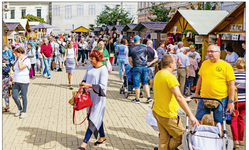
KÖZFoglalkoztatott VÁSÁR. Miskolcon is népszerű az Erzsébet téren tartandó közfoglalkoztatott vásár. Csütörtökön és pénteken korosztálytól függetlenül igen sokan látogattak ki. E rendezvény is elősegíti a kistélepülések felzárkózását, a közfoglalkoztatás munkajövedelmet biztosít segély helyett.

A fejlesztések háttéréről, gazdasági hatásairól a 2. oldalon olvashatnak, és hogy a munkaerőpiac hogyan reagál majd a mintegy 2 ezer új munkahely létrejöttére, arról a 3. oldalon írunk. MN