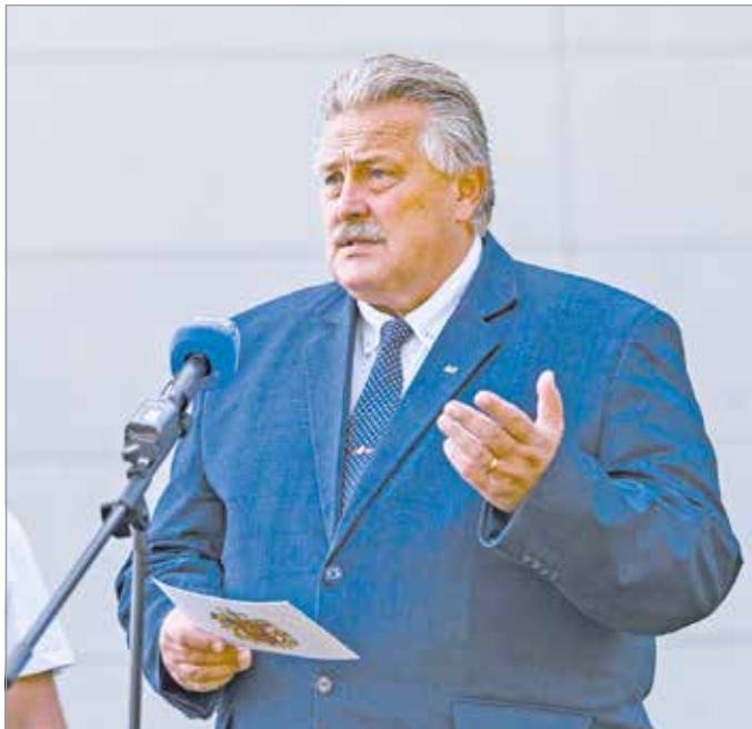
Veres Pál, Miskolc polgármestere.

Úgy fogalmazott, bár nem tudnak versenyezni ezekkel a lehetőségekkel, de „nem is kicsivel” kiegészíti a város azt a forrást, ami az úszásoktatáshoz szükséges.