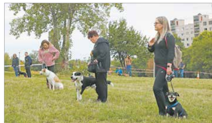
Másodszor rendezik meg a kutyaszépségsversenyt.

– Tavaly nagy siker és érdeklődés mellett rendeztük meg a kutyás napot, amelynek a kutyaszépségsverseny volt a fő programja. A kutyák és a kutyások találkozója és ismerkedése mellett fontos eleme a rendezvénynek, hogy párbeszédet generáljunk arról, milyen az ideális együttélés a házi kedvencekkel a lakótelepen. Ennek jegyében társadalmisítottuk a kutyafuttatók házi rendjének megalkotását, és