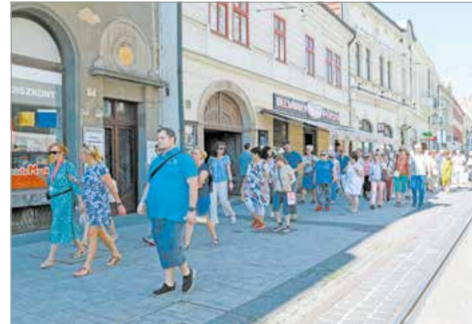
A Tourinform iroda városnéző sétái redkivül népszerűek.

Szeptember 27-én világszeret a turizmus világnapját ünneplik 1980 óta. Miskolc turizmusmarketingjéért felelős szervezete, a MIDMAR Kft. igyekszik évről évre egyedi és emlékezetes programokkal, akciókkal ráirányítani a figyelmet a turizmus fontosságára és szépségeire. Az egy hétig tartó események sora szeptember 23-án, szombaton, 10 órakor kezdődik, amikor 'Selmezbányától Miskolcig' címmel az Egyetemvárosban indul garantált városnéző séta. Szeptember 26-án, kedden, a Miskolci SZC Berzeviczy Gergely