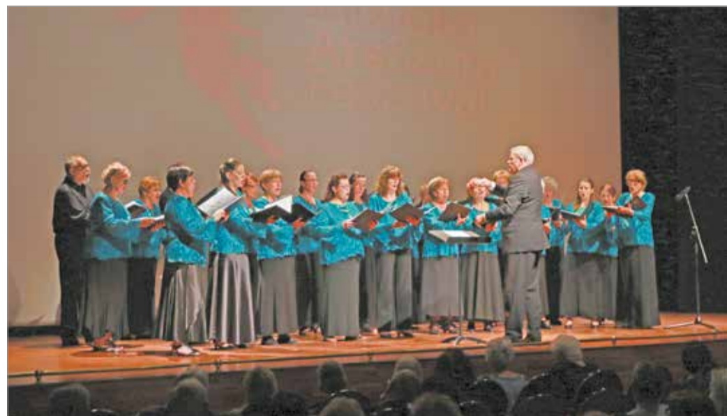
A miskolci nyitógálát vasárnap este a Művészetek Házában tartották.