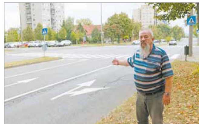
Újra jól láthatóak a közlekedési jelek.

A képviselő kiemelte, a közlekedésben résztvevők számára – legyenek gyalogosok vagy járművezetők – rendkívül fontos, hogy mindenki jól lássa egymást.