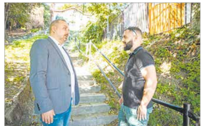
Újra akcióba kezd a város és a civilek.

A beruházás része annak a Terület- és Településfejlesztési Operatív Programnak, amelyben csaknem 900 millió forintot fordíthat az önkormányzat több lépcsőben zöldítésre, sétautak kialakítására és parkosításra. MN