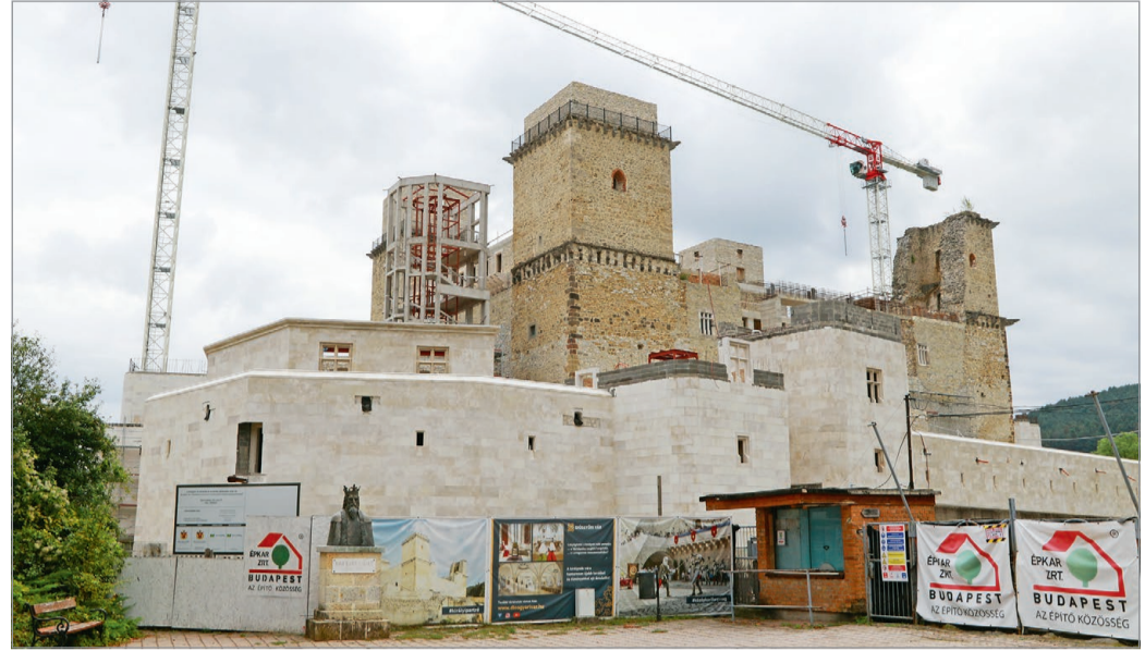
Hosszú hónapok óta áll a beruházás.

Ő azt írta a beruházás kapcsán, hogy sokszor lehet olvasni történelemkönyvekben, hogy barbárok leromboltak valamit,