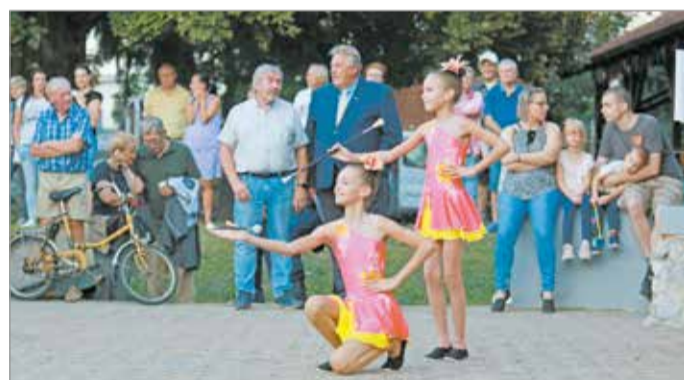
A rendezvényen a Miskolci Mazsorett Együttes is fellépett.

– Görömbölyre mindig nagy örömmel jövök, hiszen ez egy olyan városrész, ahol pezseg az élet, mindig történik valami, és hihetetlen vendégzerrettel fogadják az idelátoga-