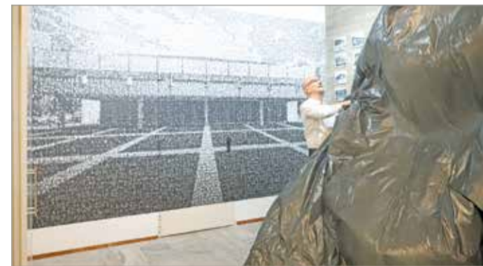
Az emlékfal leleplezésének pillanata.

A Vasas Szerszámközpontot működtető cég ügyvezető-tulajdonosát – idézte fel az emlékfal avatásán – számtalan emlék köti az épülethez. Szívesen mesélte most is fiatalkori élményét egy Hofi-előadásról, de járt itt iskolabálokon és más