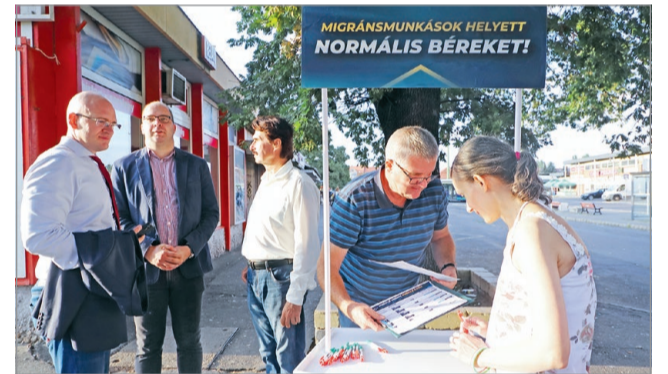
Hétfőn a Búza téren gyűjtötték az aláírásokat.