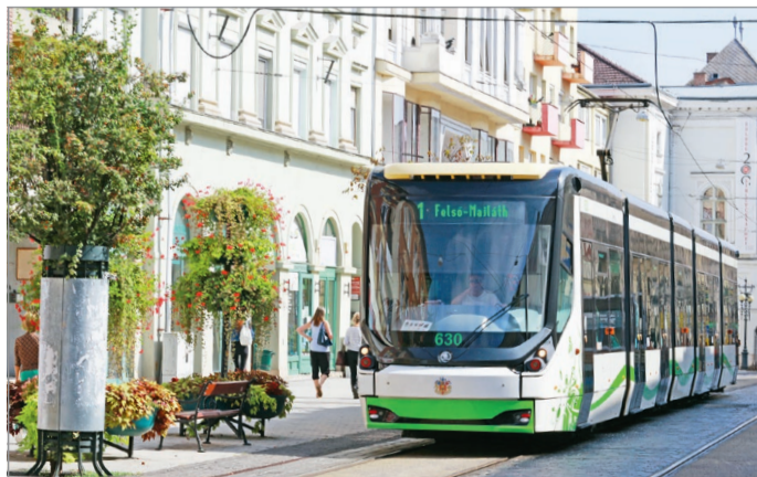
A változások a villamosokat is érinthetik.