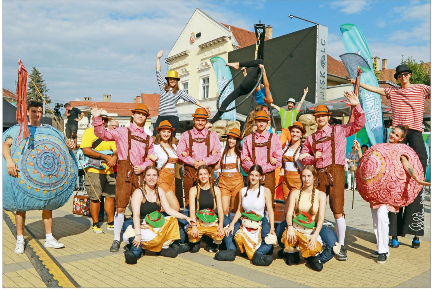
Az ünnepélyes nyitófelvonulással kezdődött el pénteken délután a Miskolci Piknik a belvárosban.