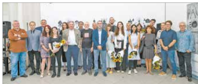
Több mint nyolcvan alkotó összesen 146 alkotásából állt össze az idei tárlat

Köszöntőjében Veres Pál polgármester a pezsgő miskolci kulturális életet méltatta, emlékeztetve, hogy 2023 a kultúra éve Miskolcon, amit számtalan programmal igyekszik megünnepelni a város. Hozzátette, Miskolc a képzőművészetben is „maradandót alkotott”, a hagyomány azonban kötelez: fontos, hogy megbecsüljék az alkotókat, akik munkásságukkal hozzájárulnak a település és környezete fejlődéséhez.