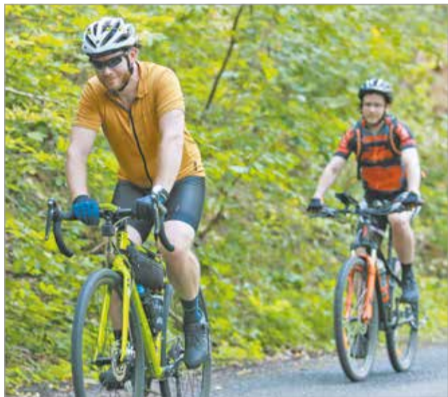
A túrán négy távon lehetett indulni.