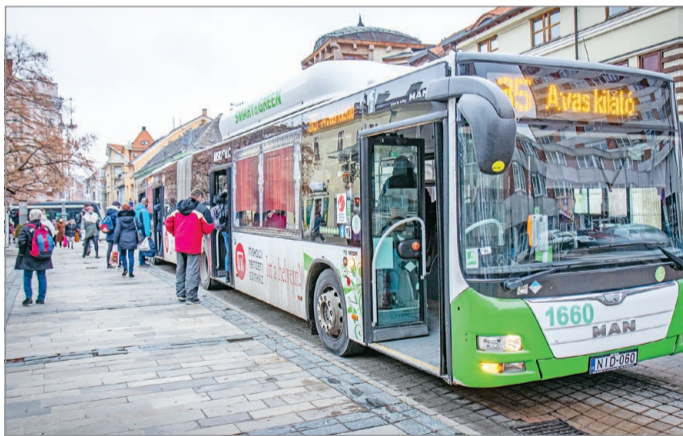
A 35-ös is sűrűbben járna.

Mint mondta, Miskolc vilamosflottája az egyik legkorszerűbb az országban, és pozi-