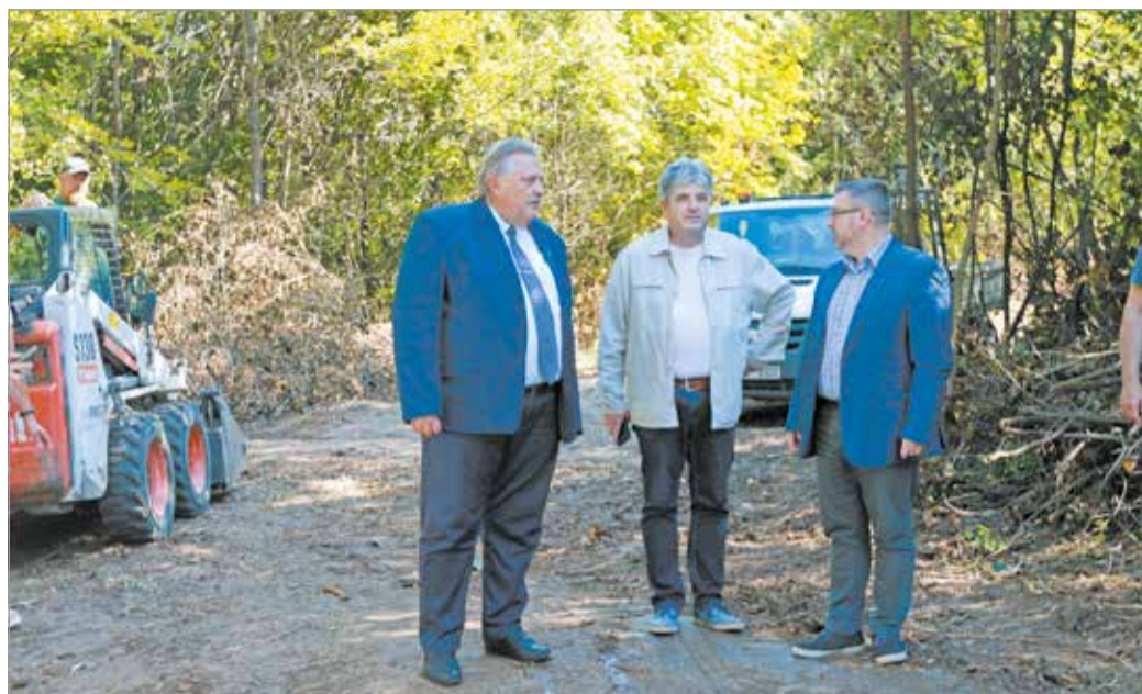
Az új erdei ösvény összeköti a Perczel Mór utca és a Kálvária-domb környékét.

A bejárson Veres Pál polgármester kiemelte, az új erdei ösvény összeköti a Perczel Mór utca és a Kálvária-domb környékét az avasi pincesorokkal. Az új gyalogos szakasz burkola-