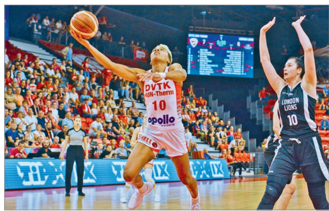
A London Lionst legyőzve csoportkörben a DVTK.