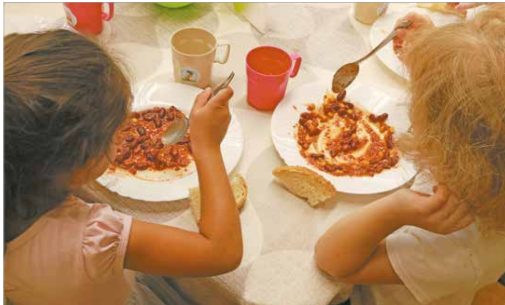
Az önkormányzat igyekszik kigazdálkodni a megemelkedett költségeket.

A rendszert három forrásból tartják fenn a települések: a köz-