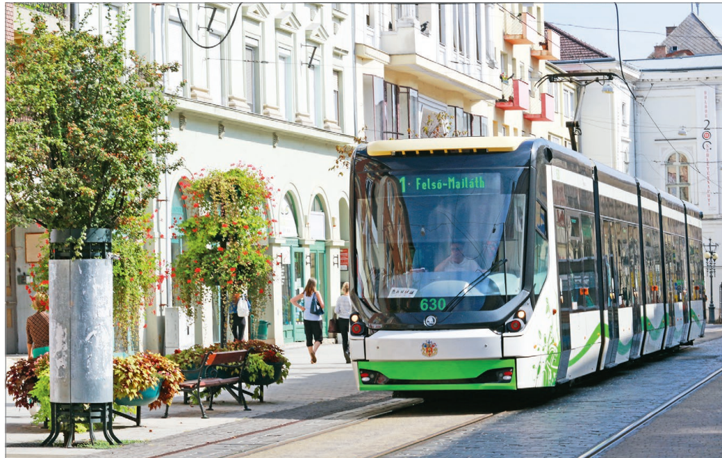
Munkanapokon reggel és délután sűrűbben járnak majd a villamosok.

A 44-es vonala meghosszabbodik a Búza térig, reggel