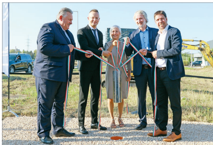
Az üzem alapkövét csütörtökön rakták le.