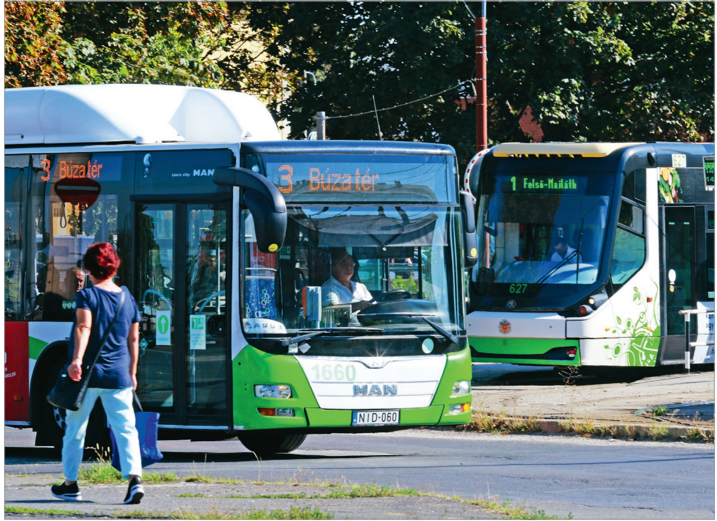
Október közepétől gyakrabban járnak a buszok Szirmára is.

Új menetrend és új vonalhá- lázat lép életbe október 14- étől Miskolcon, mivel az erről szóló javaslatot megszavazta szeptember 28-án a miskolci közgyűlés.