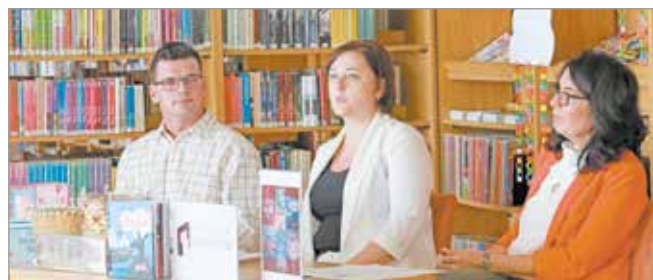
A rendezvénysorozat programjait sajtótájékoztatón ismertették.

Az Országos Könyvtári Napok zárónapján rendezik