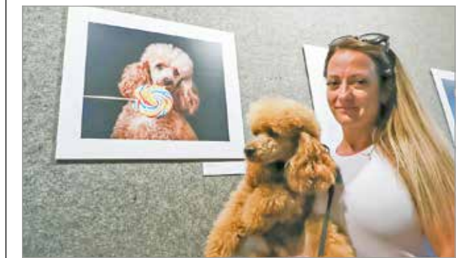
A kiállítás Tóth Zsuzsa mintegy 40 alkotását mutatja be.