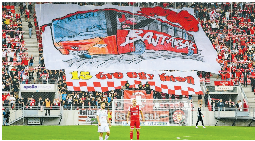
Debrecenbe induló buszt ábrázoló diósgyőri drapéria a DVTK-DVSC rangadón.

Ahogy azt a diósgyőri szurkolói portál, az amigeleken.hu is megírta, a Bajtársak szurkolói csoport idén ünnepli a tizenötödik születésnapját, és ebből az alkalomból látványos koreográfiával készültek a diósgyőri ultrák. A csoport ugyanis éppen egy debreceni túra alkalmával alakult meg, ezért is szerepelt a molinón Debrecen mint úti cél. De a jó kapcsolat jeleként a vezetőedzők, Szergej Kuznyecov és Srdjan Blagojevic is a szurkolótáborok közötti barátságot hirdető pólóban vonult ki a kezdéshez.