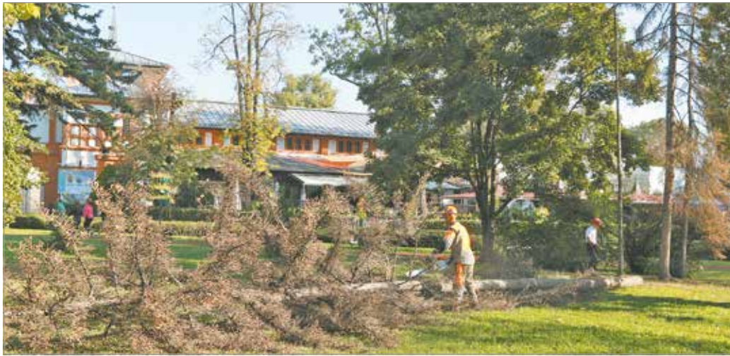
Tucatjával haltak ki az év folyamán a fenyőfélék is.

„Rengeteg olyan probléma van, amelyet a normál fásor-