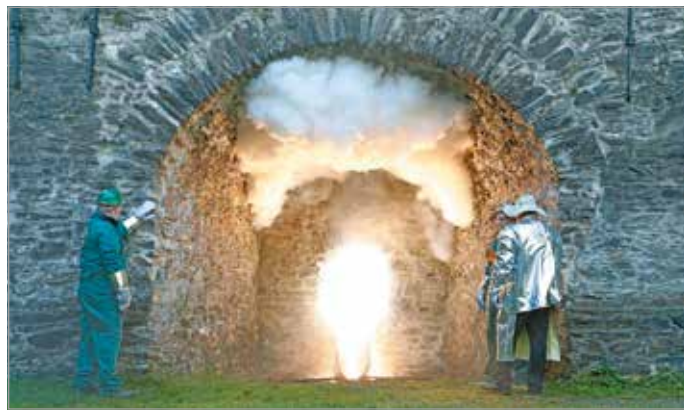
Idén sem marad el a tradicionális látványcsapolás.