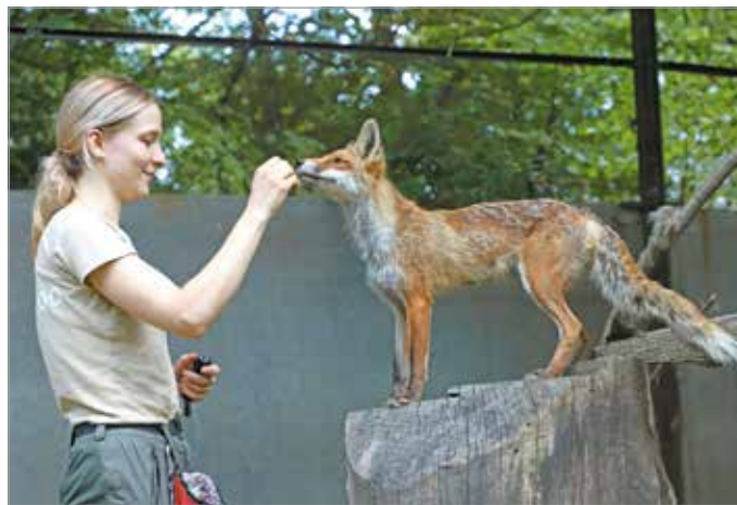
Látványtettesekkel is várják a látogatókat.

Az állatok világnapja alkalmából október 1-jén, vasár-