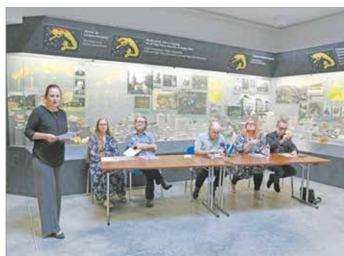
Idén ősszel is változatos programokat kínál a múzeum.

A bőséges kínálatból kiemel-ték a „Pannon10 – Őserdő a szénbányában” című, csütörtökön megtartott ismeretter-jesztő előadást, amelyben az idén tízéves Pannon-tenger Múzeum létrehozásáról, a bükkábrányi ősfák felfede-zéséről, feltárásáról és konzerválásáról emlékeztek meg. „Hogy mennyire jó ötlet volt ezt az új múzeumi kiállítóhe-lyet felépíteni, mi sem igazolja jobban, mint az, hogy lényegében a megnyitástól kezdve egészen a mai napig a múzeumi szervezetünk leglátogatottabb