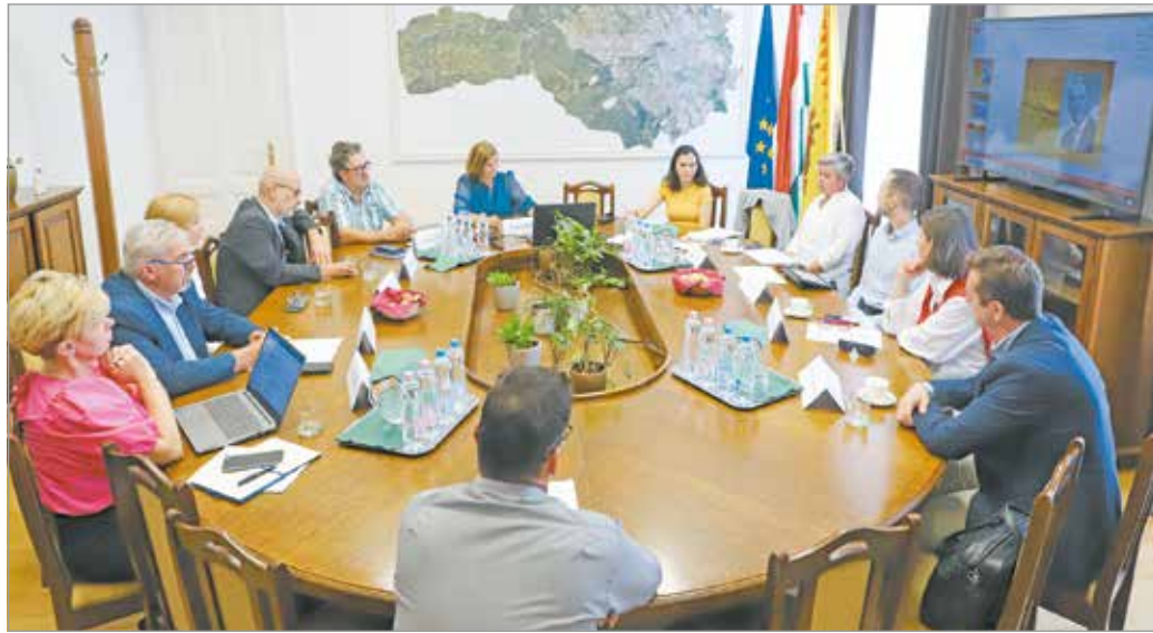
Ülést tartott a bizottság, az értéktár bővítéséről döntöttek.