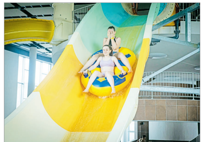
Élményekben gazdag fürdője van Miskolcnak.

– Hétfőtől ismét kinyit a Selyemréti Strandfürdő, egyelőre azonban még csak az úszómedencét és a dögönyözőmedencét használhatják a vendégek. A munkák a többi medence esetében folytatódnak, de ez nem zavarja majd a fürdőzés élményét. Teljes kapacitással május