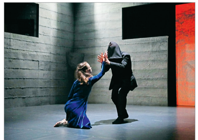
A szerelem hatalma a Miskolci Balett előadásában.

A miskolci táncosok Abélard és Héloise egymásra találását és tragikus elválását dolgozták fel. Az előadás koreográfus-rendezője, Kozma Attila a tragédia gyö-