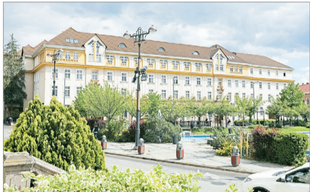
A nagypostán alakítanak ki 0-24 órás ügyfélteret.