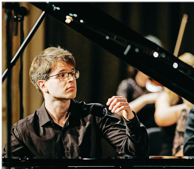
A Zenepalotában lép fel Ránki Fülöp.

Ránki Fülöp a műsort alkotó Liszt- és Ravel-mesterművekről azt mondta, hogy egyszerre jellemzi őket a mély érzés és szárnyaló képzelet, a végtelen színkészlet és mértéktartó forma, a túlvilági érzetek és hangzásvilág. Ravel keringőciklusának valódi egységével Liszt egy nyelvezetben írt, de különálló kerindgői állnak szemben, majd a Vigasztalások intim hangjára a Ravel Gaspard de la nuit túlvilági látomásai felelnek.