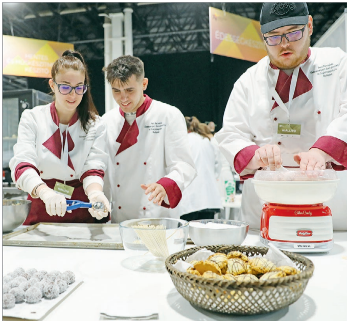
Az országos versennyel a szakmatanulás fontosságára hívják fel a figyelmet.