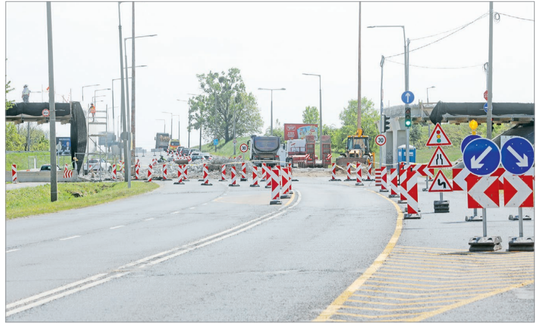
A felüljárót az eredeti paraméterek mellett állítják helyre, marad a magassága is.

„Miután a tervek elkészültek, jöhetett az építési közbeszerzési eljárás, ami sikeresen le is zajlott, így tavasszal elkezdődhetek a munkálatok” – je-