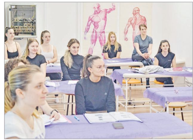
Új környezetben a gyógytornászhallgatók.