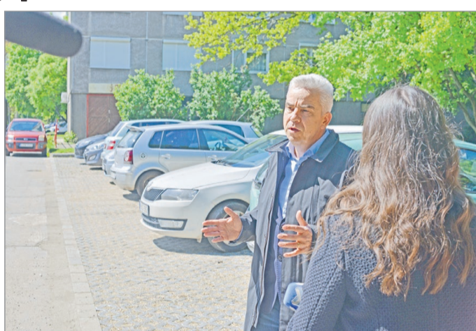
Simon Gábor körzetében folytatódott a munka.

A mostani parkolóhely-bővítés csaknem négymillió forintból valósult meg a város költségvetéséből.