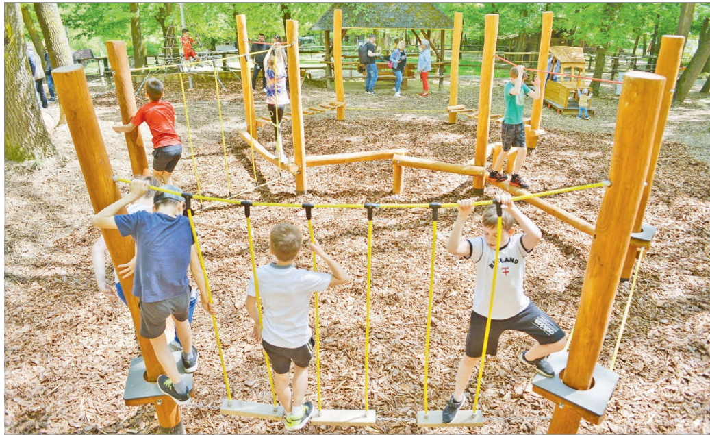
A játszószerkezeteket már az átadó közben birtokba vette a célközönség.

Rámutatott, a játszótérek tervezésekor fontos szempont volt, hogy illeszkedjenek a fás, erdei környezetbe, ezért a felszerelt eszközök, elemek nagyobb hányada is zömmel fából és más természetes anyagokból készültek. Örömmel állapította meg,