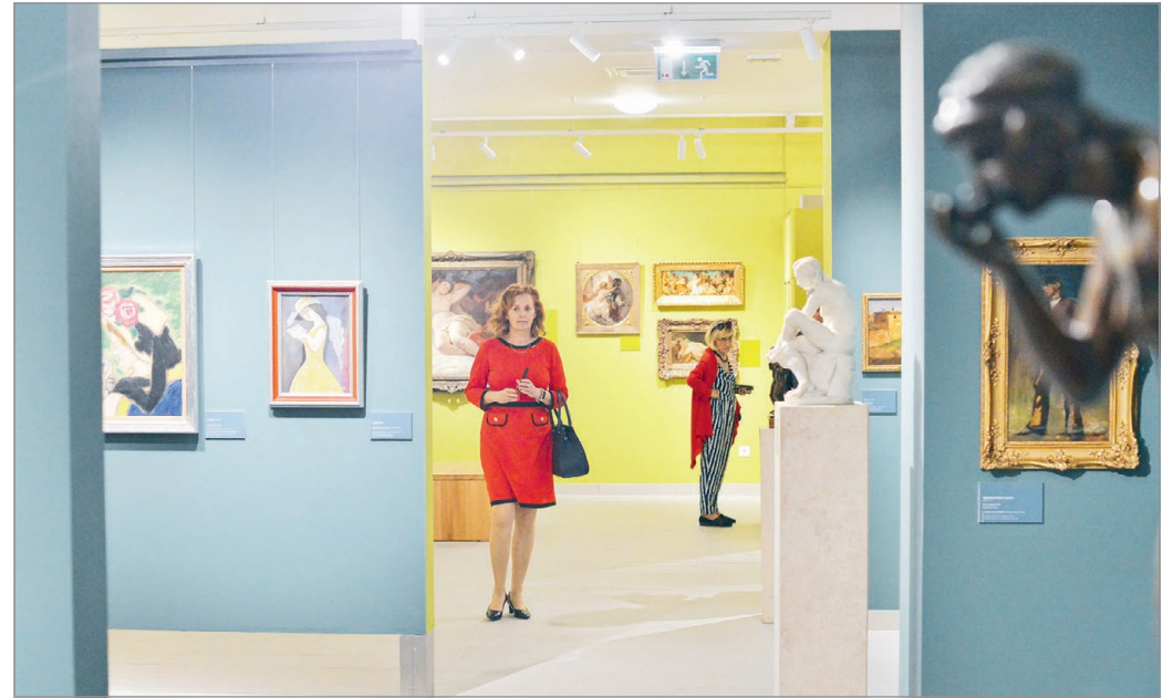
Az átadó után szinte azonnal megérkeztek az első látogatók az új Képtárba.

Beszélt arról is a polgármester, hogy az idén 125 éves Herman Ottó Múzeum történetéhez olyan nevek kapcsolódnak, mint Leszih Andor, Gálffy Ignác, Megay Géza vagy Soltész Nagy Kálmán – meglátása szerint most minden biztonnal büszkének az utódaikra. Múzeumtörténeti pillanatok is látogathatók.