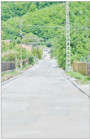
A padka már kész, jöhet az aszfalt.