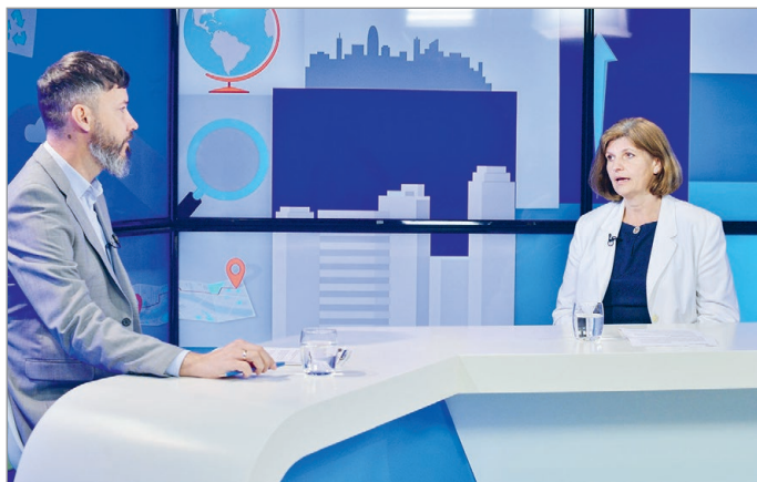
A projekt során új, innovatív módszereket is kipróbáltak.