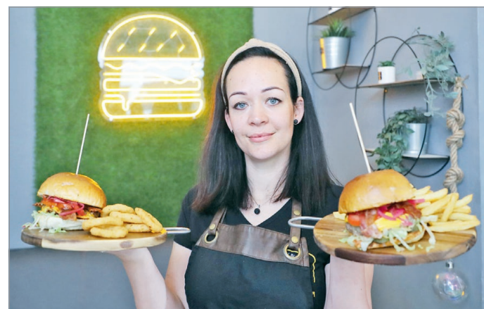
Február vége óta újabb hamburgeres kínálatával bővült a sétálóút.