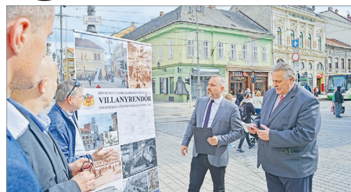
Néhány héten belül ismét látható a villanyrendőr.