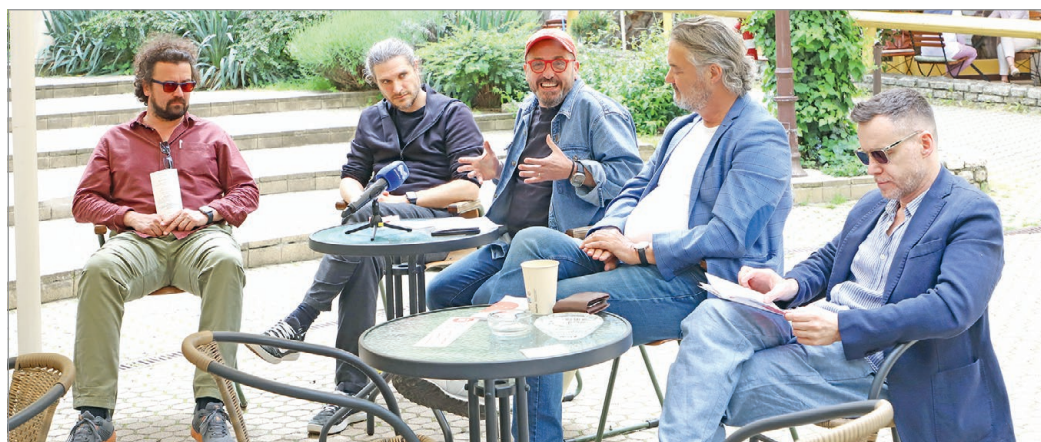
Ismerette a 201. évad műsortervét a miskolci teátrum vezetése.