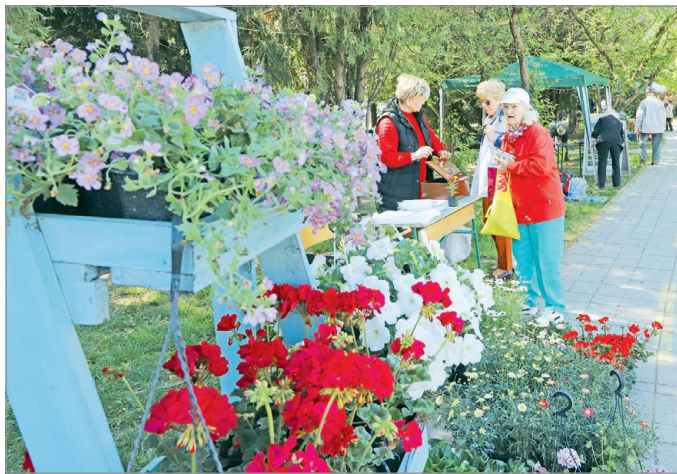
A rendezvény a kertről, a virágokról és a szabadidőről szól.

Harmadik alkalommal rendezzük meg Miskolcon az ország legnagyobb – fővároson kívüli – kert, otthon és szabadidő tematikában életre hívott kiállítását. A háromnapos programnak festői környezetben, az Avas lábánál, ősfákkal szegélyezett területen, a városi sportszarnok (Generali Aréna) előtti tér ad otthont. Idén a sportszarnok küzdőterének felújítása miatt a belső térben nem lesznek kiállítók, csak az épü-