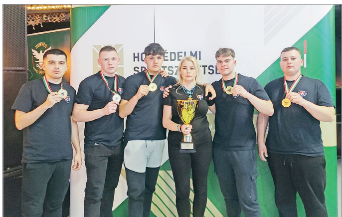
A hazafias és honvédelmi nevelést erősítő megmérettetést az Andrassy csapata nyerte.