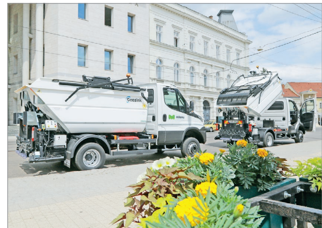
A MiReHu szolgáltatási területén is könnyebben azonosíthatóak lesznek a hulladékgyűjtők.

Kiemelik, azoknak az ügyfeleknek, akik több felhasználási hellyel, illetve eltérő nagyságú edényzettel