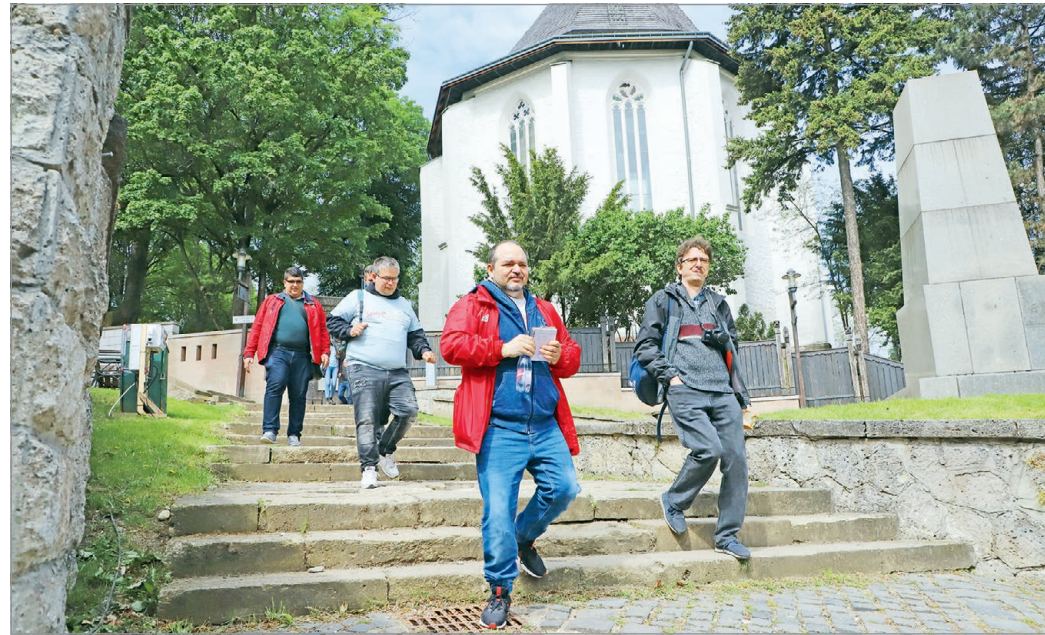
Miskolc kedvenc társasjátékán évről évre a város ismert helyszíneivel kapcsolatos feladványokat kell megoldaniuk a résztvevőknek.

Elmondta, a kérdések miskolci kuriózumokra irányulnak majd: irodalmi, képzőművészeti, kulturális, régészeti, szakrális, történelmi és zenei területről. Akik pedig a játékban részt vesznek, úgy mehetnek haza,