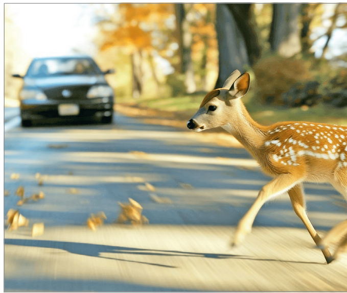
Biztos recept nincs a vadgázolás elkerülésére, de lehet tenni a balesetek esélyének csökkentéséért.

A járművezetőnek ilyenkor is figyelnie kell a többi autós biztonságára, vagyis szabadon kell tennie az utat, és el kell távolítani az úttestről a sérült kocsik alkatrészeit – hangsúlyozta Varga János, aki megosztotta, a rendőrök értesítik a balesetről a Közutat, akik el-