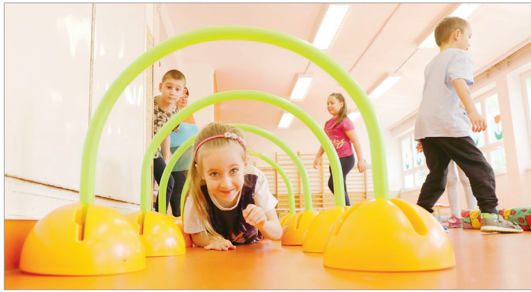
A szakemberek tapasztalata az, hogy egy hónap alatt a gyerekek megszokják az óvodát.

– A pelenkáság számunkra csak abból a szempontból jelent nehézséget, hogy nincs pelenkázóhelyiségünk, mert nem gondozási tevékenységet látunk el. Ennek ellenére pró-