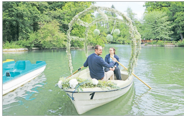
Az eddigiek mellett már baldachinnal díszített csónak is van Miskolctapolcán.

Az alkalom tehát kivételes. A többi nap kapcsán a cégvezető hangsúlyozta: vendégeik felé csupán anynyi a kérésük, hogy a 11 és 19 óra között biztosított szolgáltatás igénybevételét legalább két-három órával előtte jelezzék számukra a sales@miskolcifurdok.hu-n keresztül. MN