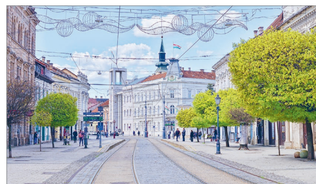
A húszemeletes értékesítése mellett egyre több sétálóutcai üzletnek talál új bérlőt a Miskolc Holding.