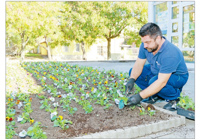
A város több pontján is megkezdődik hétfőn a virágosítás.