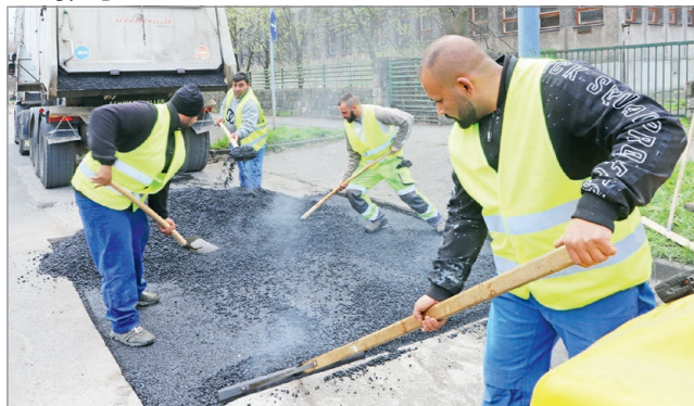
Városszerte javítják az utakat.