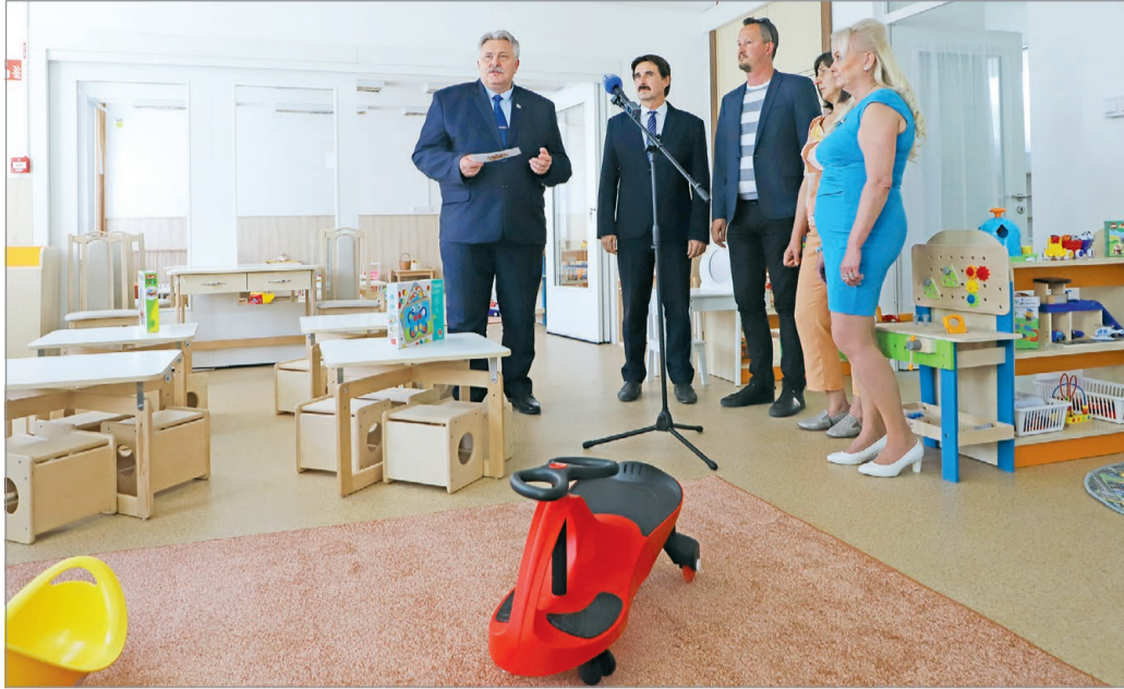
Az egyik legmodernebb miskolci bölcsődét adták át a város vezetői a héten.

A felújított bölcsőde szerdai átadásán a műszaki paraméterek ismertetésén túl Veres Pál emlékeztetett: amikor a város-