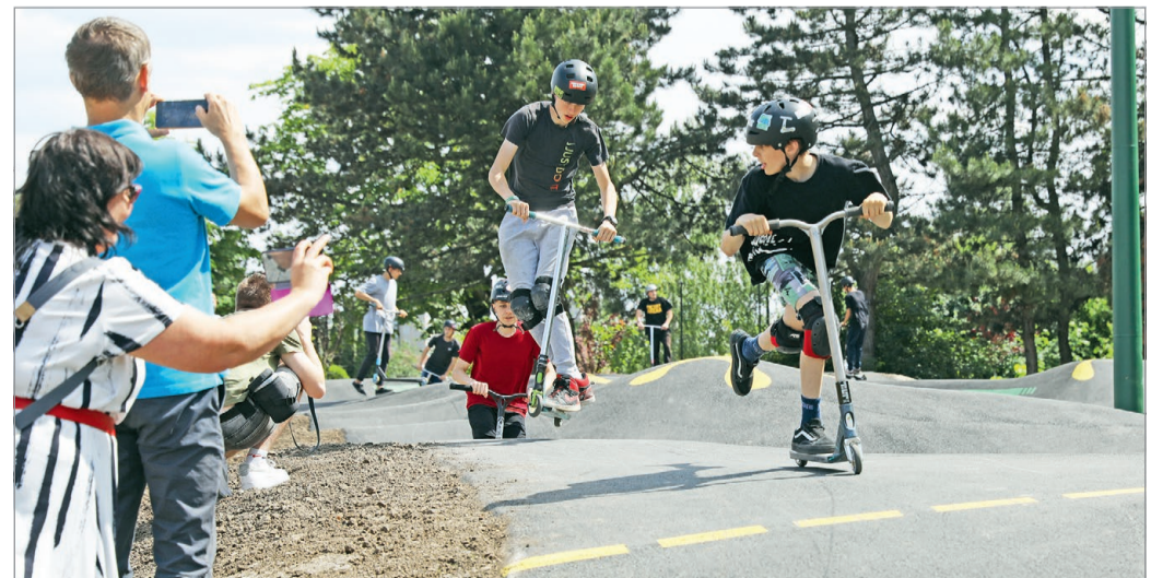
A pálya biztonságos élményt nyújt kerékpárosoknak, gördeszkásoknak, görkorisoknak, rollereseknek egyaránt.