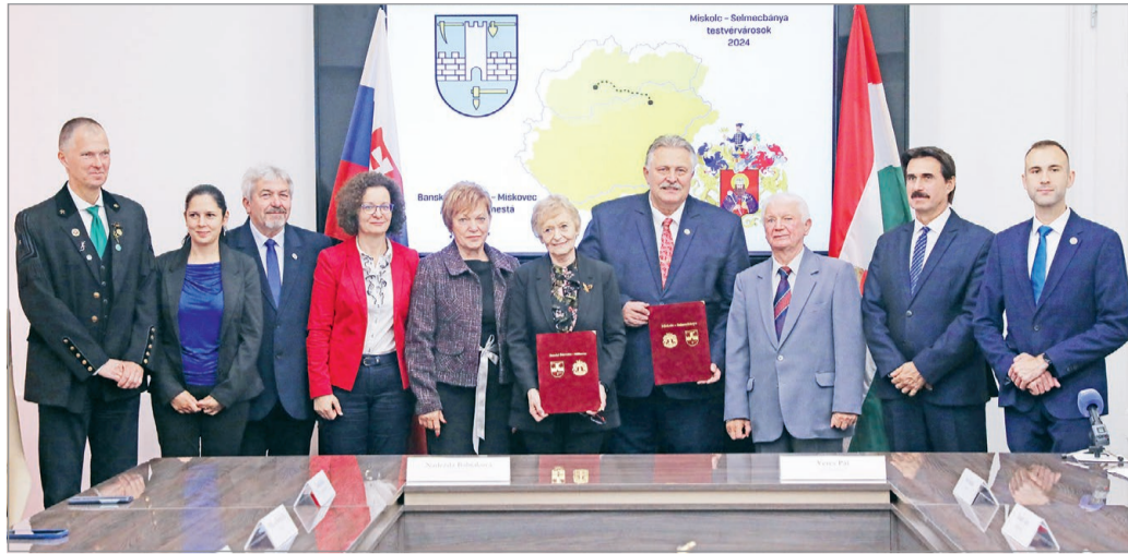
Miskolc, a Miskolci Egyetem és Selmecebánya vezetői az együttműködés aláírásánál.

– Selmecebánya adott otthont a világ első műszaki felsőoktatási intézményének, amely 1735-ben jött létre, és itt kezdte meg működését a világ első bányászati akadémiaja 1770-ben, amelyre mi, miskolciak a mi egyetemünk elődjeként tekintünk. A Miskolci Egyetem hallgatói mind a mai napig ismerik, ápolják a selmeci hagyományokat, ami az egyetemi polgárság, a hallgatói lét alapját és központi elemét jelenti – húzta alá.