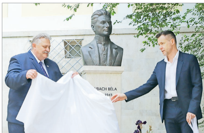
Leleplezték Jenbach Béla szobrát.