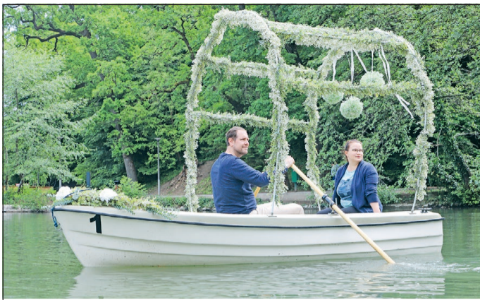
Pünkösdkor is népszerű Miskolc.