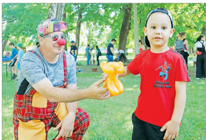
Lufihajtogatás nélkül nincs gyermeknap.