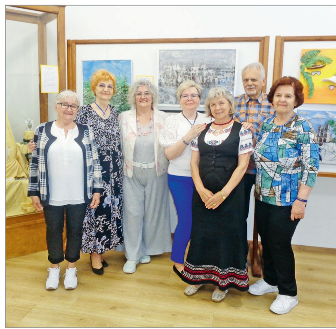
Kiállítással egybekötött alkotónapot is tartottak.