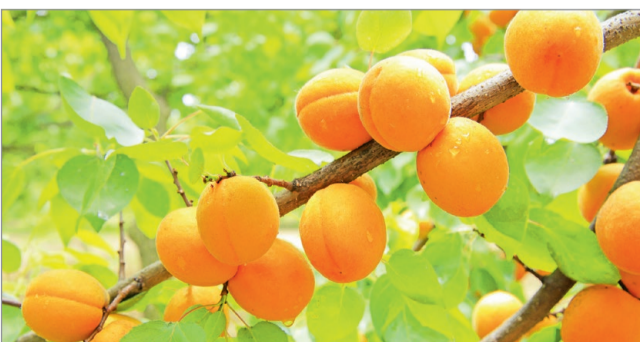
Az előző évekhez képest jobban alakult a termés.