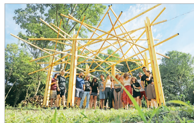
A három elkészült alkotás egyike az Avason.