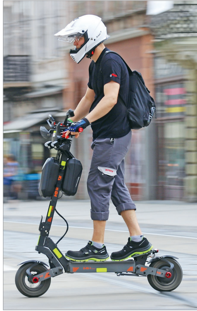
Nem minden rollerre kell majd biztosítást kötni.

Érdekes helyzeteket szülehet a jogszabály azon passzusára, hogy a nyilvántartásba nem vett, rendszám nélküli járművek esetében, mint a roller vagy