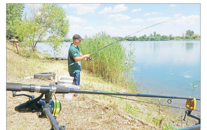
Rekreációs tevékenységből lassan méregdrága hobbivá válik a horgászat.