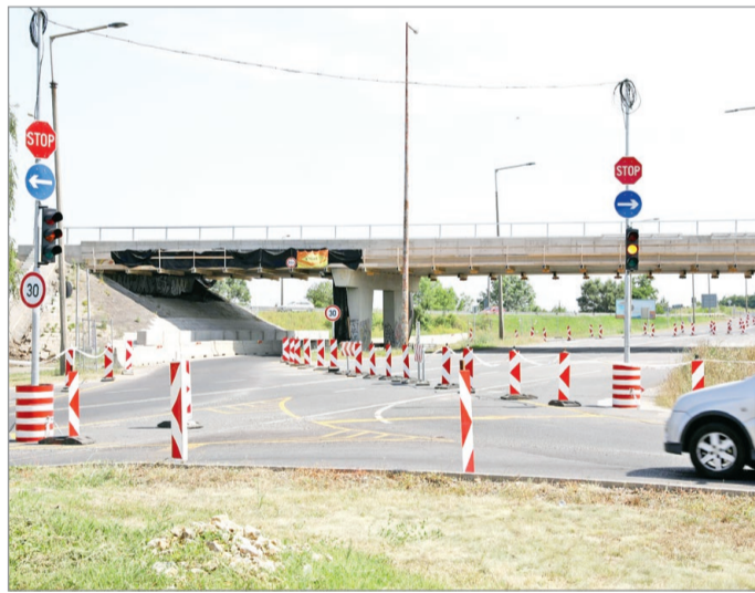
A felüljáró két éve egy baleset során sérült meg.

A balesetet követően a közút szakemberei megvizsgálták a hidat, majd külső szakértői vé-