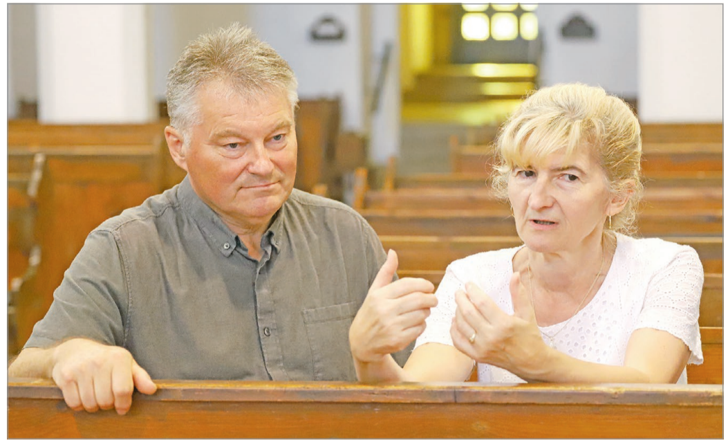
A lelkészpár húsz éve Aggtelekről érkezett Miskolc ősi templomába.

– Nagyon elégedettek lehetünk azzal, hogy a gyülekezet életképes, jó összetételű és nagyvonalú. A ránk hagyott