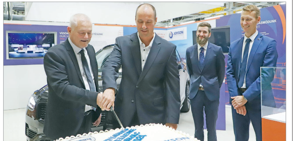
Továbbra is együttműködik a svéd autógyártó és a Joyson miskolci gyára.