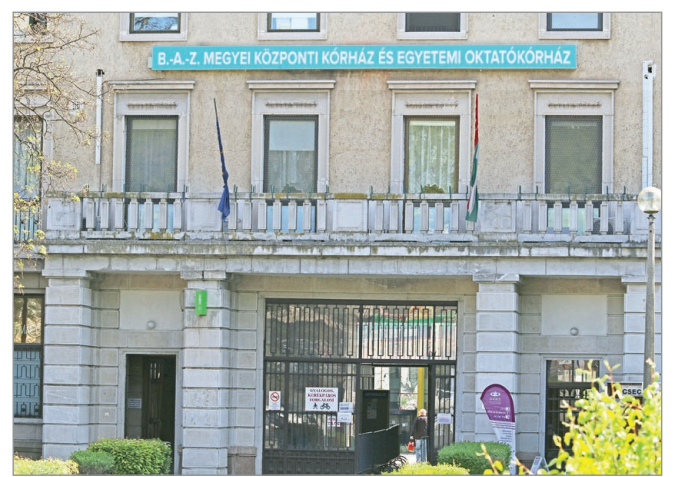
A vármegyei központi kórház főbejárata.