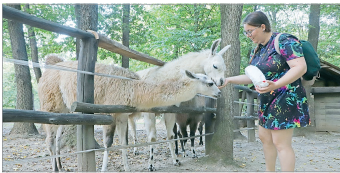
A program minden évben nagy népszerűségnek örvend.