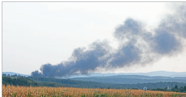
A füstoszlopot a környező településekről is látni lehetett.