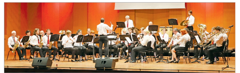
Májusban még a MŰHÁ-ban koncertezett a zenekar.