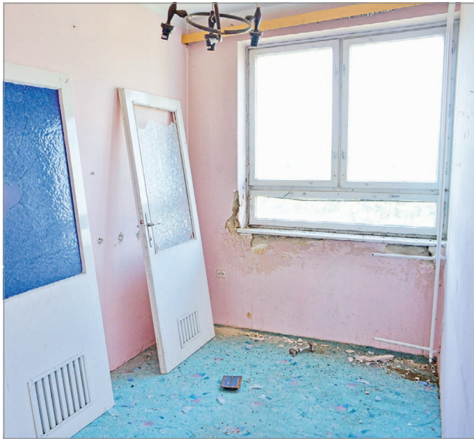
Hamarosan kívül-belül megújulhat a húszemeletes.