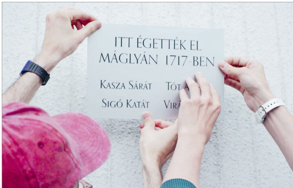
A tábla kihelyezésének pillanata.