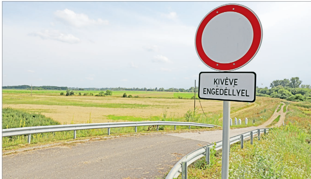
Több kérdés is felmerült a lakosság részéről a tervezett reptérrel kapcsolatban.

Nemrégiben azonban rendkívüli közgyűlésen fogadta el a városvezetés azt a telepítési tanulmánytervet, amelyben az szerepelt, hogy egy sportrepülőtér alakítanak ki magánbefektetők a Csorba-tó és a