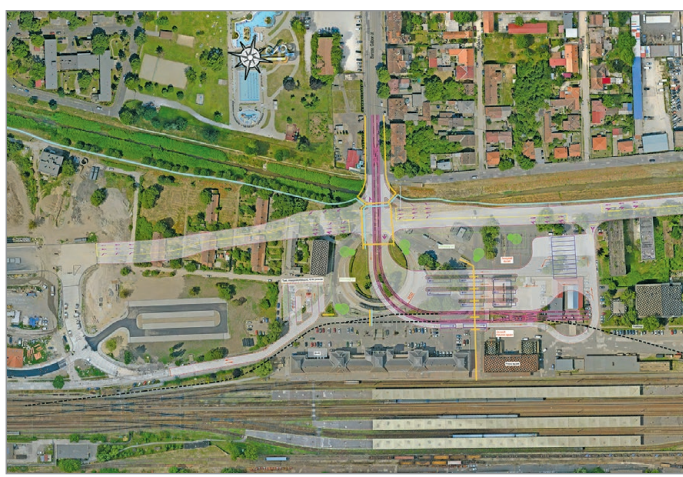
Az Y-híd hármas ütemének koncepcióterve