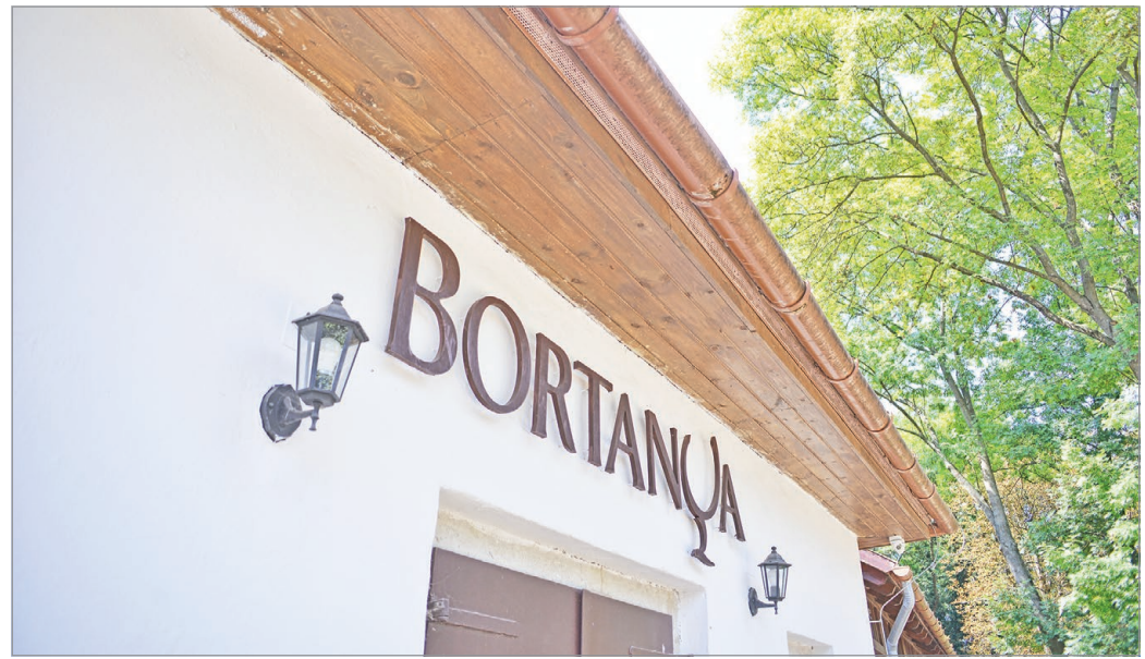
A Bortanya is várja leendő üzemeltetőjét.

A Miskolc Holding ingatlangazdálkodási igazgatója idén áprilisban a helyszínen elmondta: a kávézó és az amfiteátrum mellett az Avasi Bortanya is rövidesen bérlőre talál majd, miu-