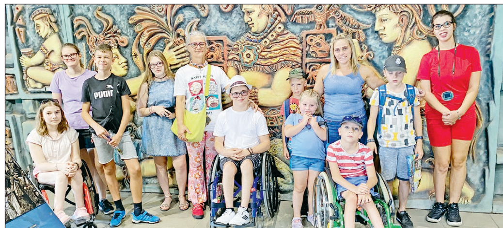
A NYÁR MINDENKINEK JÁR. A Velkey László Gyermekegészségügyi Központ gyermekrehabilitációs osztályán gyógyuló kis betegek nyári kikapcsolódásának, táborozásának feltételeit nem egyszerű dolog megteremteni, de mégis minden évben megszervezi az osztály elkötelezett közössége és az őket támogató alapítvány. Az idén az Első Miskolci Lions Club a MEAFC-cal közösen segítette a nemes célt: az éves augusztusi tábor résztvevőinek utaztatását megoldották, és még egy nyíregyházi vadasparki látogatás is belefért.

Nagyon szeretem az alternatívabb és performatívabb emléktáblák kiállításait, amelyek mostanában leginkább színházi körökben tűnnek fel. Van valami szép abban, ahogy egy emléktábla a közös terünkről mesél el egy olyan történetet, ami a térhez tapad. Emléktáblák jellemzően férfiaknak szoktak állítani, mi most viszont nőkről, áldozatokról szerettük volna megemlékezni, illetve olyan eseményről, amely Miskolc történelméből kitakaródik – fejtette ki az alkotót.