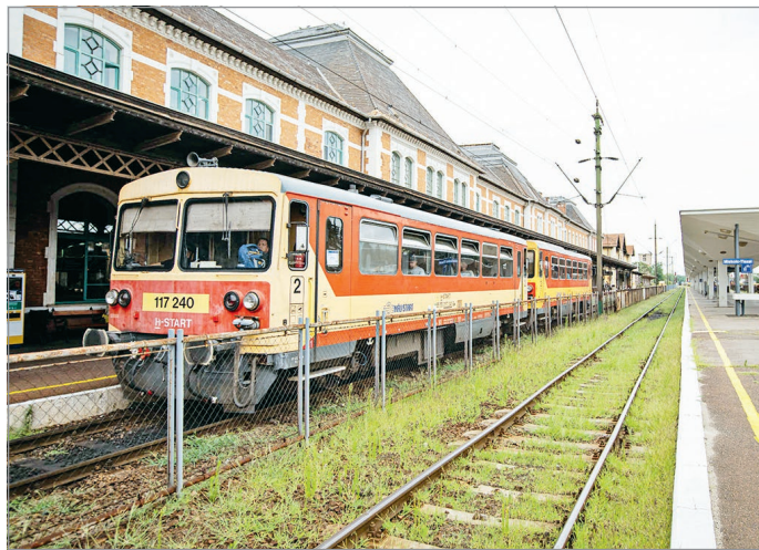
A rekonstrukció miatt jelentősen módosul a vasúti menetrend.

A felújítás ideje alatt csak egy vágányon, több sebességkorlátozás mellett – Füzesabony és Miskolc között többlet megállási helyekkel – közlekedhetnek a vonatok a munkálatokkal érintett vonalszakaszokon, ezért óránként és irányonként napközben csak egy-egy személyszállító vonat tud áthaladni, emiatt jelentősen módosul a menetrend. Ezért az utasoknak Budapest – Miskolc viszonylatban mintegy fél órával hosszabb eljutási időre kell számítaniuk.