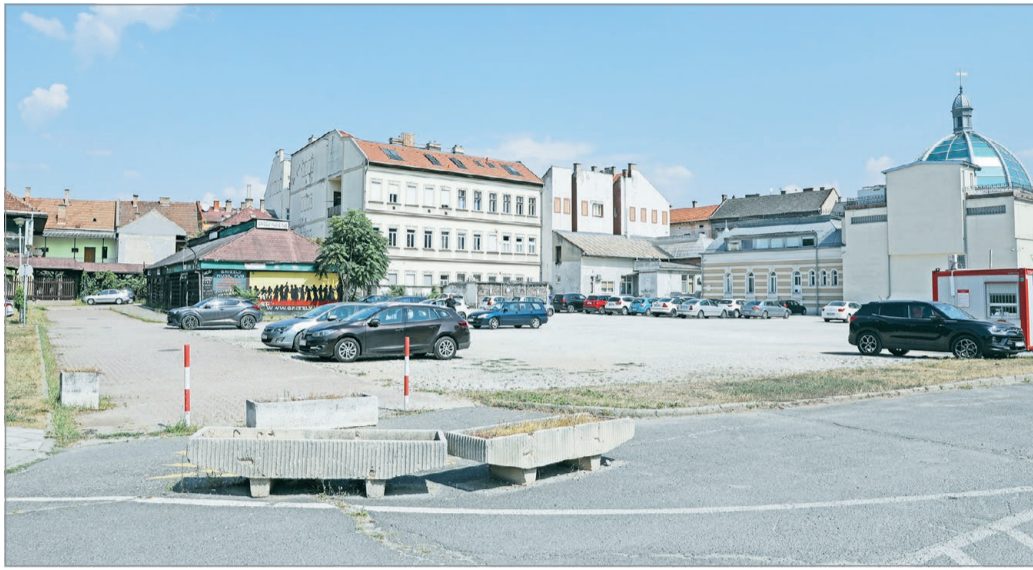
Több kísérletet is tettek már a belvárosi foghíj hasznosítására.

A Hell cégcsoporthoz tartozó Avalon Center Kft. előbb egy felsőkategóriás irodaházat tervezett a területre, azonban ezt a szándékot nem támogatták a környéken élők, és egy civil érdekvédelem csoport is tiltakozott ellene. Így végül ez a projekt nem kapta meg az építési engedélyt, újabb esztendőkre maradt a murvás parkoló a Szent István tér mellett. A tu-