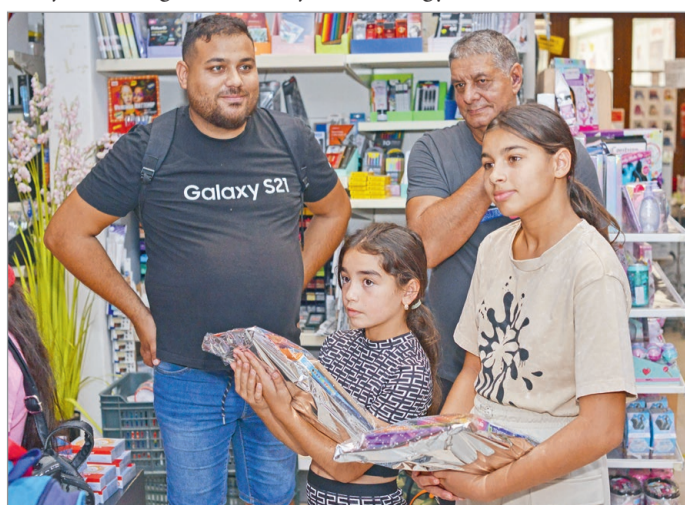
Nagy segítség volt ez a családoknak.

A tanszerek átadása után pizzával vendégelték meg a gyerekeket. Természetesen mindenkinek jutott a pizzából, a gyerekek jóízűen ebédeltek. Az étteremmel közösen legközelebb jégkorongmeccsre mennek a gyerekek. BÓDOGH DÁVID