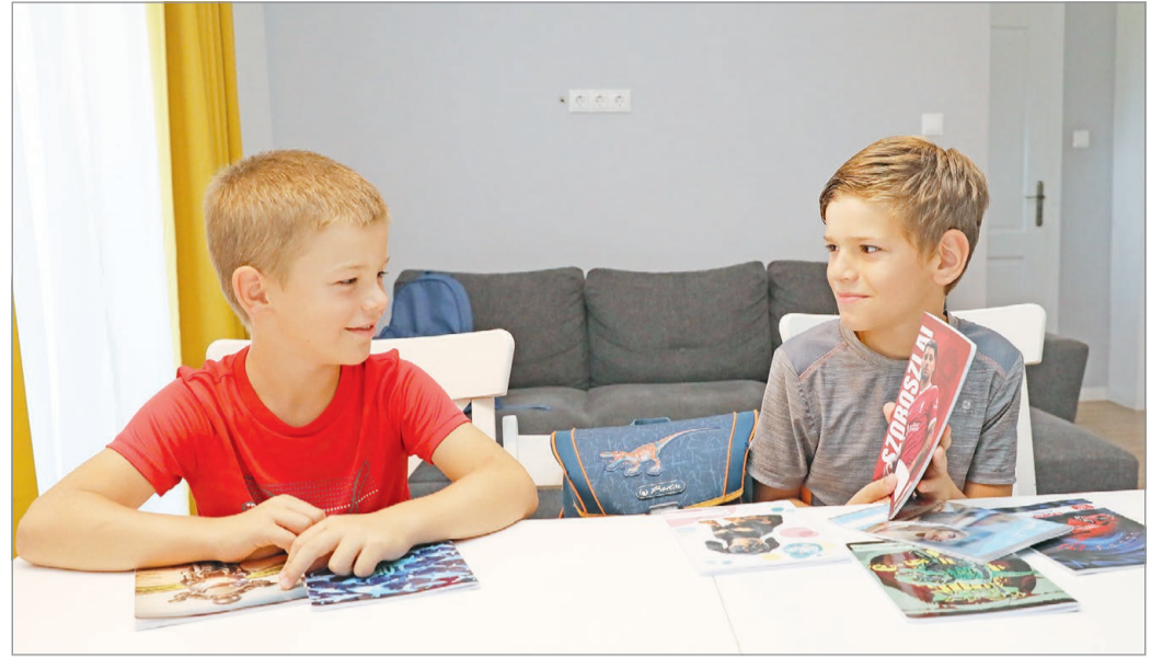
Becsengenek hétfőn a hazai iskolákban.

Megtudtuk, az ország egyik legnagyobb szakképzési centrumában a 9. évfolyamra beiratkozott tanulók száma idén közel 1300, a kizárólag szakmai vizsgára felkészítő évfolyamokra je-