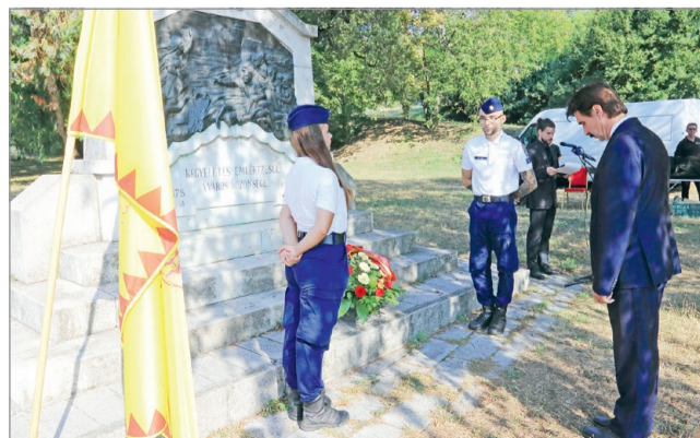
A város nevében Badány Lajos rótta le kegyeletét.