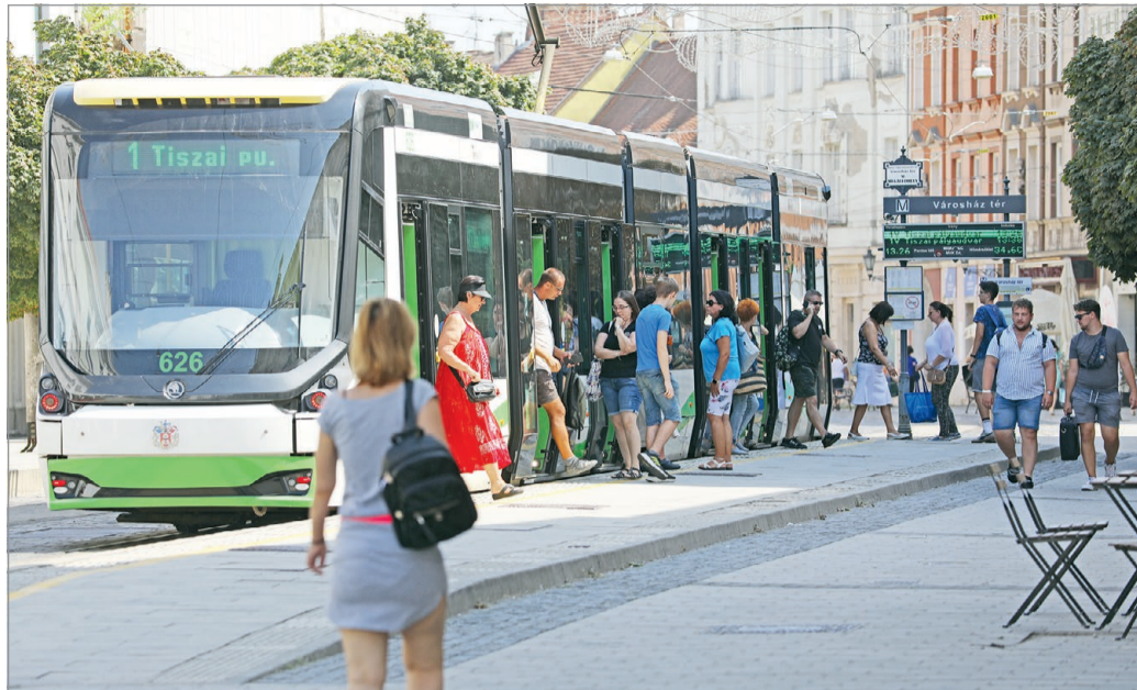
Hétfőtől ismét megnövekszik az utasok száma városunkban.

– Utasaink kérésére egyetemi vizsga- és szüneti időszakban a Búza tér végállomásról 06:50-kor, 07:03-kor, 07:13-kor és 07:23-kor induló 20A-s autóbusszjárat a Tanulmányi épületek megállóhely és az Egyetemváros végállomás érintésével közlekedik – számolt be a vállalat villamosközlekedési igazgatója lapunknak.