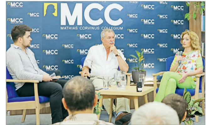
Farkas Bertalan méltatta a következő magyar űrhajóst, Kapu Tibort.

– Az utóbbi hat évben megötszöröztük az Európai Űrügynökségbe befizetett és onnan egyébként teljes egészében hazahozott forrás mennyiségét, és megtízszereztük az Európai Űrügynökség által regisztrált magyar partnerek számát – ismertette űrutasításért felelős miniszteri biztos. Hozzátette, további céljuk a többi közt a hazai űrutasítás fejlesztése. MN