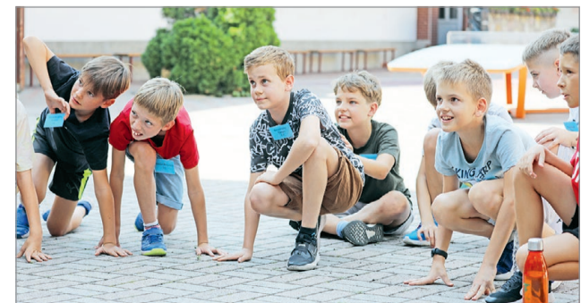
Fontos, hogy már a tanév kezdete előtt találkozzanak.