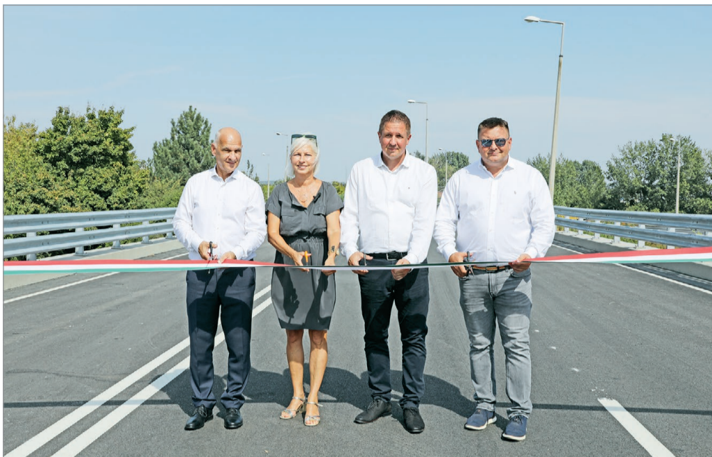
A szalagvágás megvolt, szeptember elejétől már autók közlekednek a felüljárón.

Csőbör Katalin emlékezett, egy ilyen elkerülhető bal-