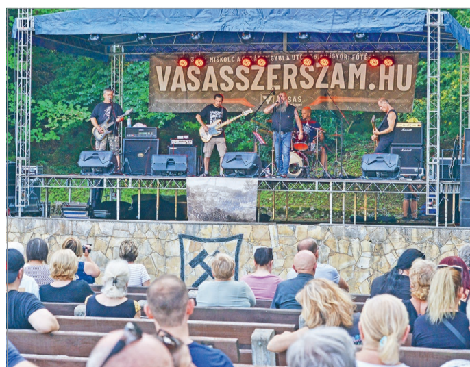
A fesztivál minden évben népszerű program a helyiek körében.

– A mi együttesünk mellett, amely szintén fellép, megkerülhetetlen volt a legendás miskolci Excelsior zenekar is.