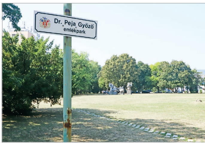
A Kiliánban is rekortánpálya várja majd a miskolciakat.

Miskolc jelenleg legnagyobb futókörét egyébként 2022 májusában adták át a Népkertben. Az egy kilométer hosszú, kifejezetten futásra kialakított rekortánborítású pálya hamar népszerű lett a sportolás szerelmesei között, több nagy sportrendezvényt is tartottak már a területen, legutóbb éppen a múlt vasárnapi Nyárbúcsúztató Futónapot. A városvezetés reményei szerint a dr. Peja Győző emlékparkba tervezett rekortánpálya legalább ugyanilyen népszerűségnek fog örvendeni a miskolciak körében.