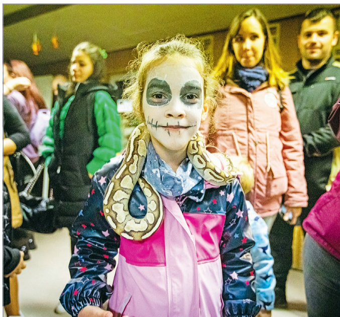
Ingyenes arcfestés változtatja majd át a gyerekeket.

Idén is megrendezi hagyományos Halloween Estjét a Miskolci Állatkert október 31-én, csütörtökön délután öt és este kilenc óra között. Az esemény részeként idén tökfara-gó versenyt is hirdetnek. Az otthon elkészített töklámpásokat október 29-én és 30-án, reggel kilenc és délután öt óra között lehet leadni az állatkert pénztárában. Az első három helyezett jutalomban részesül, amelynek eredményét október 31-én teszik közzé a Miskolci Állatkert Facebook-oldalán, de a nyerteseket e-mailben is értesítik. Az első három helyezett töklámpást az oktatóteremnél állítják majd ki, míg a többit az állatkert területén helyezik ki.