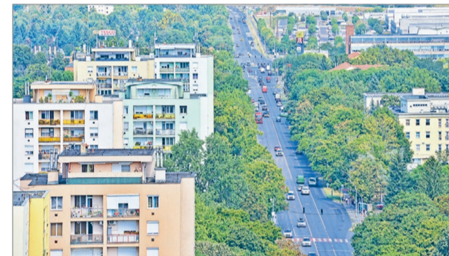
Közel hatvan lakást hirdettek meg ezúttal.