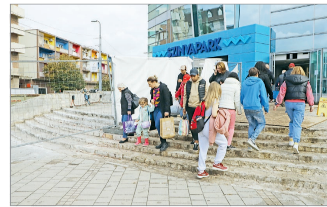
Nemcsak szebb, hanem biztonságosabb is lesz.