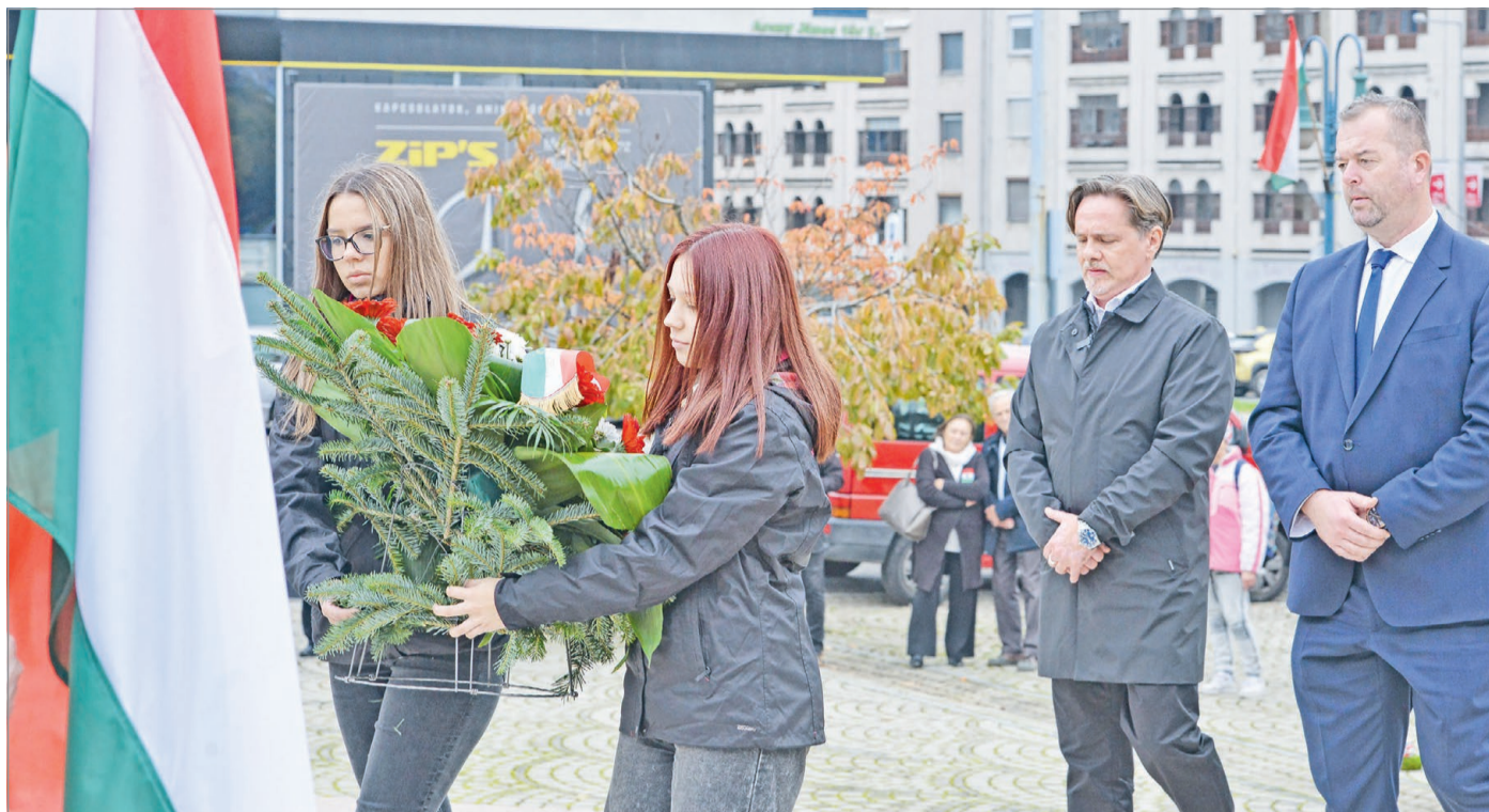
A hagyományoknak megfelelően idén is a Petőfi tér volt a miskolci városi ünnepségek központi helyszíne.

– Az, hogy ma egy független, szabad és szuverén Magyarországon élhetünk, az eredendően 1956 ismert és névtelen hőseinek köszönhető. A mi szabadságunk alapjait az ő akkori bátorságuk és áldozatuk teremtette meg. Ezért magyar ember soha nem feledheti 1956 hőseit – hangsúlyozta, hozzátéve: ugyan a forradalom központi eseményei a fővárosban történtek, azonban „joggal lehetünk rá büsz-