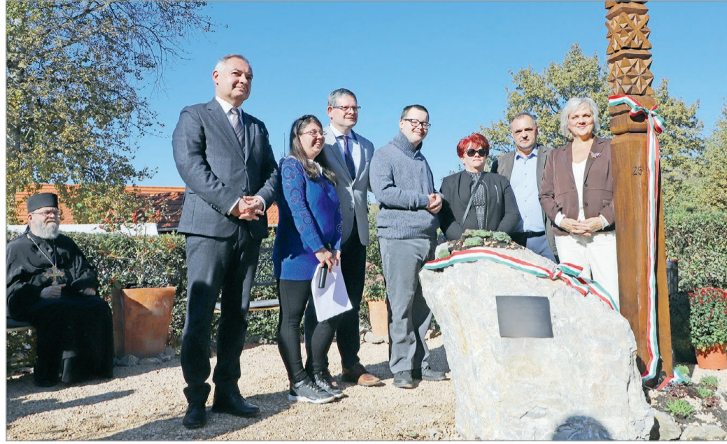
Felavatták az életfa motívumos kopjafát és a sziklatömböt a Baráthegyi Majorságban.

Az első bátor lépésből, hogy a kislány mellé ültetett egy fogyatékos osztálytársat, nőtt ki