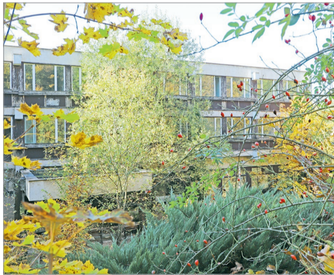
Eladásra kínálják az egykori tüdőszanatóriumot.

A hirdetés szerint a mintegy 64 ezer négyzetméteres ingatlan természetvédelmi terület szomszédságában található és két utcáról is megközelíthető. Mint írják: „az ingatlan ősfás környezetben található, a területén 8 ezer négyzetméter ingatlan felépítmény található, amelyek teljes felújítást igényelnek. Az ingatlanhoz telekhatárig közművek csatlakoznak, az épületek körül aszfaltozott utak kerültek kiépítésre, ál-