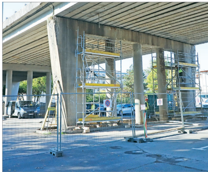
Meggengült a híd egyik támasza az elmúlt években.