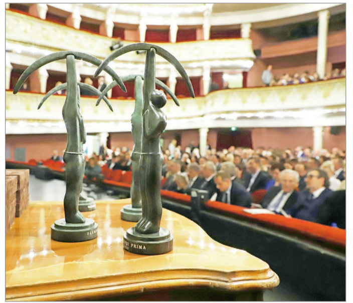
Idén is kiosztják a vármegyei Prima díjakat.

„A művészet az az alkalom és készlet, hogy reagáljunk arra, kik vagyunk, honnan jöttünk és hová tartunk. A lélek által vont kéz megtalálja, hogyan fejezze ki a dolgokhoz való viszonyát. Akkor sikeres a művészet, ha érzelmi indítatású és érzelmi érzet meg a befogadót” – vallja a művész, aki gyermekkorát Ormosbányán, keménybányászemberek között töltötte, onnan került Miskolcra, a gyári munkások közébe. Az