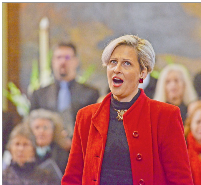
Idén nyolc napig élvezhette a közönség a kórusmuzsikát.

– Veczán Pál evangélikus lelkész és esperes életével példát adott, hiszen még máig is találkozom emberekkel, akikre ő maga, vagy legbelsőbb köre hatással volt. Ahol esperes úr és felesége dolgozott, az em-