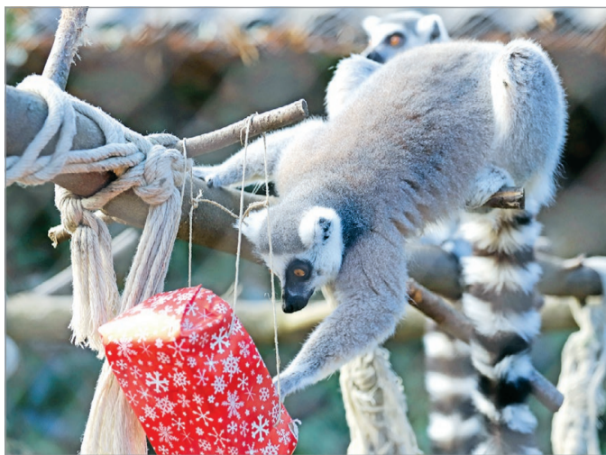
Idén újra lehetőség nyílik együtt ünnepelni a kis és nagy kedvencekkel.

Az ország legszebb természeti környezetben fekvő állatkertje minden évszakban más arcát mutatja, így a téli időszakban is érdemes ellátogatni a Miskolci Állatkertbe. A park melegkedvelő fajai ilyenkor inkább behúzódnak belsejébe, meleg kifutójukba az állatházakban, míg mások a hideg időben aktívak, és ekkor érzik otthonosan magukat. A lombosított állatokkal való etetés lehetőség nyílik betekinteni a külső kifutók olyan részeibe, melyeket tavasztól őszig a dús lombosított állatok miatt csak részben vagy alig láthatunk.