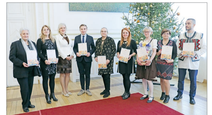
Nyolcan vehettek át elismerést a nemzetiségek napján.

Minden évben különleges pillanatot hordoz Miskolc életében ez a nap az alpolgármester szerint. – Ilyenkor tiszteletünket fejezzük ki azok irányába, akik gazdagítják városunk kultúráját és