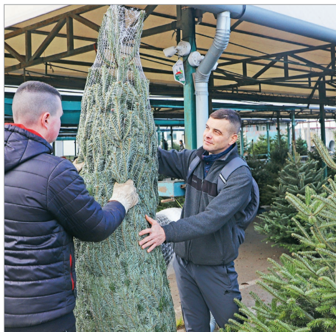
Idén is bőséges a kínálat fenyőfából a Búza téren.

– Viszettek, de kevesebbet, mint vártuk. Nagyon reméljük, hogy az ünnephez közeledve többen jönnek majd. Ez tavaly is így volt. Sokan hagyják az utolsó napokra a fenyő beszerzését, de a múlt évben is elment a készletünk azért. Reméljük, az idén is így lesz – mondta a kereskedő, hozzátéve: sokan várnak a beszerzéssel, ezt hagyják utoljára, talán