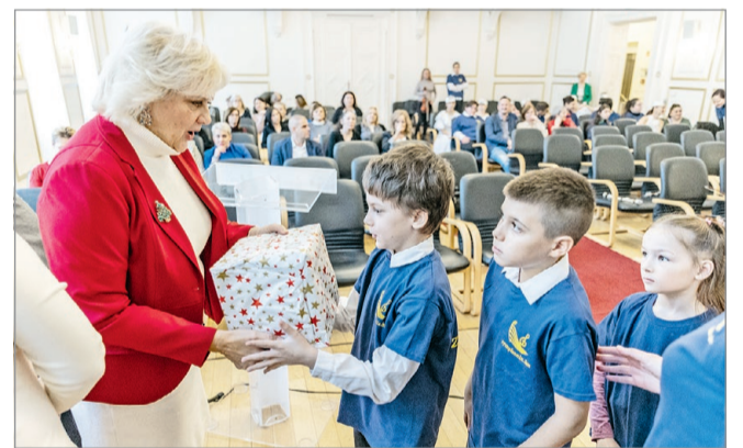
Hátrányos helyzetű gyerekeknek segítettek az önkormányzat dolgozói.