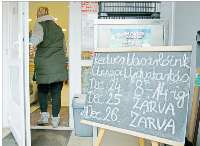
Érdeemes tájékozódni a nyitvatartásokról is.

A MÁV-Volán csoport az ünnepi időszakban egyes vo-