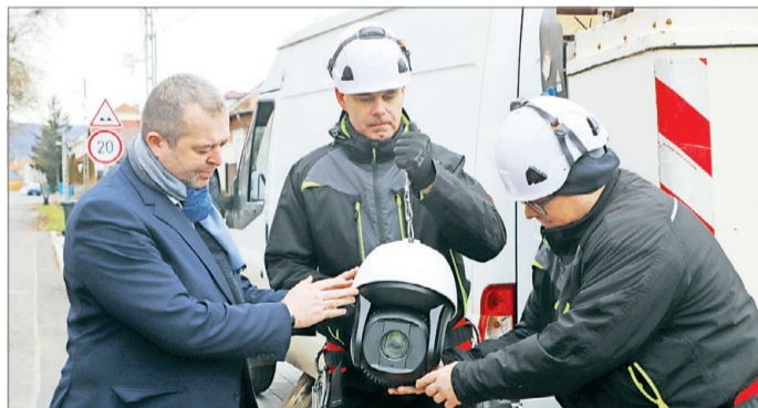
Az új kamera tovább növeli a helyiek biztonságát.