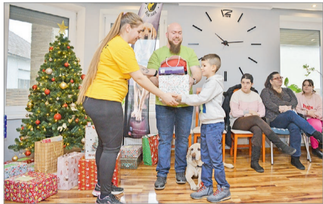
Idén már száz gyereknek segítettek.