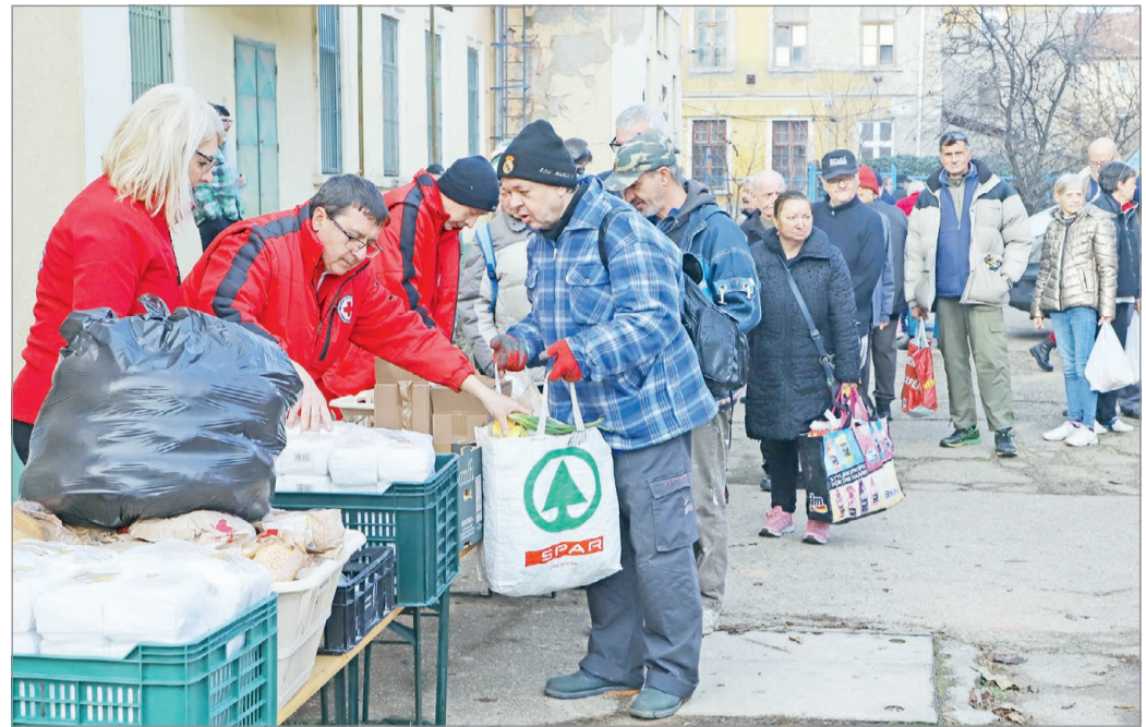
Ötszáz adag élelmiszercsomagot osztott ki kedden a Vöröskereszt.

Elmondta azt is, hogy december 18-án, szerdán, déltől a „Mindenki karácsonyát” ünnepelték intézményükben, a Baross Gábor utcai népkonyhán, amelynek keretében kétszáz adag töltött káposztát osztanak