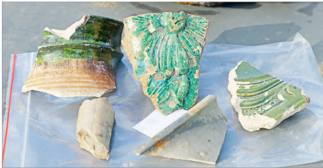
Értékes leleteket találtak az Erzsébet fürdő mögött.