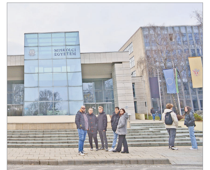
Újabb 3 ezer fő nyerhet felvételt ősszel.