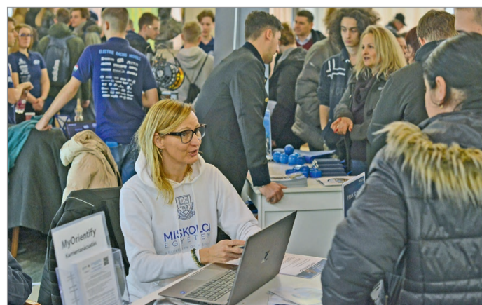
A nyílt napon kedvet kaphattak a Miskolci Egyetemhez a továbbtanulás előtt álló diákok.