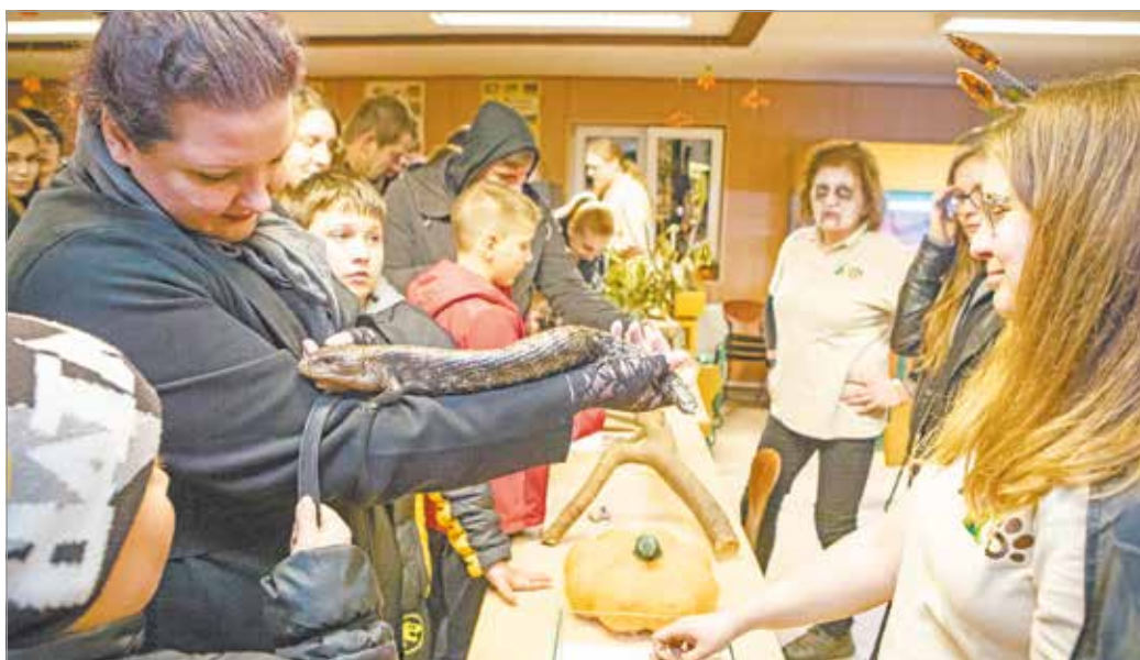
Az esti látványteretéseken betekintést nyerhetünk az éjjel is aktív állatok életébe.

Töklámpások? Fáklyák? Sötét erdő? Ragadozó macskák? Ez mind-mind megtalálható lesz a tematikus esten. E régi, kelta eredetű ünnep alkalmával egy igazán borzongató hangulatú programon vehetnek részt a bátor látogatók. Az Oktatóteremben pókok, kígyók borzolják majd