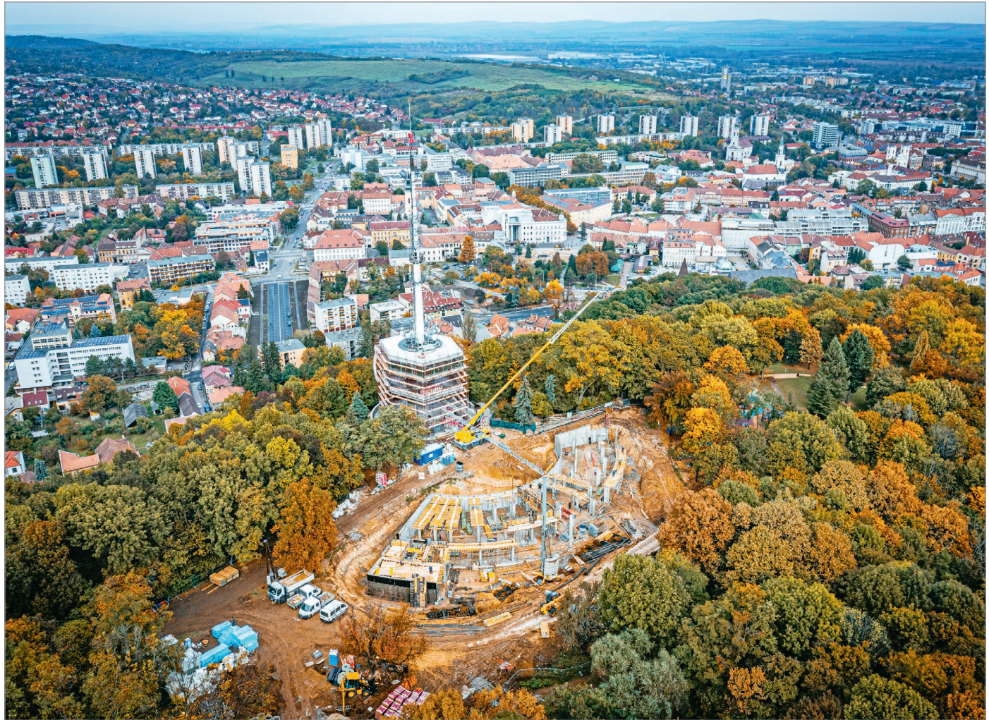
Az étterem hamarosan szerkezetkész, a kilátóban jelenleg a presszó belső tereit alakítják ki és a külső vakolási munkákat végzik.

A munkálatokat bejárson tekintették meg szerdán Miskolc város közgyűlésének tagjai.