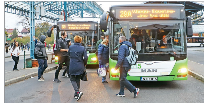
Az egyik legnagyobb újdonság a két körjárat.

Éva szintén a huszonkilences buszra várt türelmesen. Ő ezzel a járatral utazik munkába az egyetemre, haza pedig a harminckilencesel. „Szerintem mindkét járat jó. Nekem az indulási idejük is megfelel, persze most még késnek, főleg a reggeli és délutáni csúcsidőben. Problémás a helyzet akkor is, ha az egyik hamarabb érkezik be, mint ahogy a másiknak indulnia kellene, mert akkor tumultus alakul ki a megállóban, és nem lehet tudni, hogy hirtelen hova is szaladjon az ember, de ez idővel nyilván rendeződik majd. Azt hallottam, hogy a tizenkilences járat csatlakozási lehetősége nem megoldott. A Komlóstétőre bejáró kollégáim beszélnek, hogy nincs idejük átszállni az egyik járatról a másikra. Nem irigylem a sofőröket, mert nagyon nagy a hajtás” – mondta.