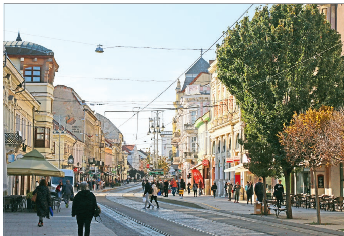
Közös érdek, hogy rendezett legyen a városkép.

Ahogy arról a város főépítésze lapunk megkeresésére rámutatott: a településképi védelméről szóló önkormányzati rendelet részletesen nevesíti azon követelményeket, melyeknek meg kell felelniük az ingatlanulajdonosoknak. MN