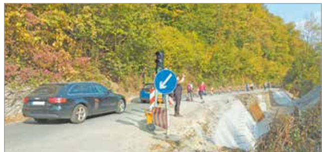
A támfal helyreállítása szeptember végén kezdődött meg.