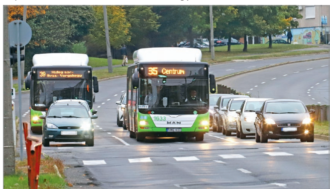
Egy pillanatra sem állhat le a város tömegközlekedése.