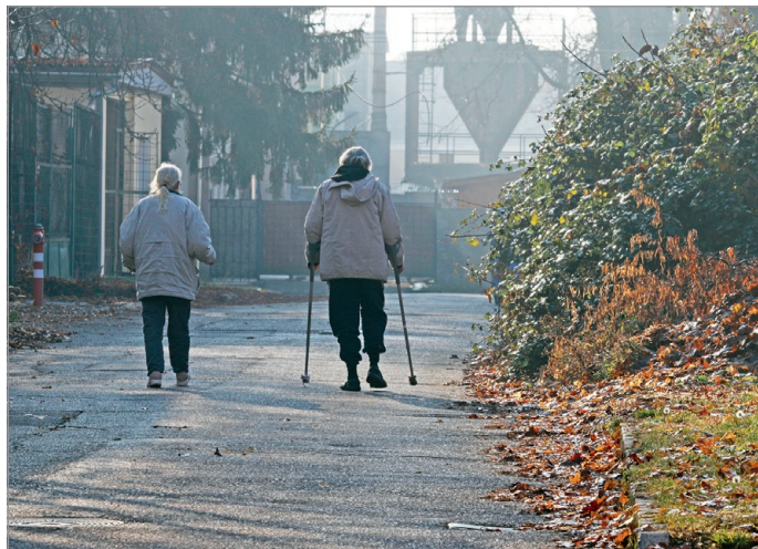
A városban átlagosan négy-ötszáz között mozog a hajléktalanok száma.