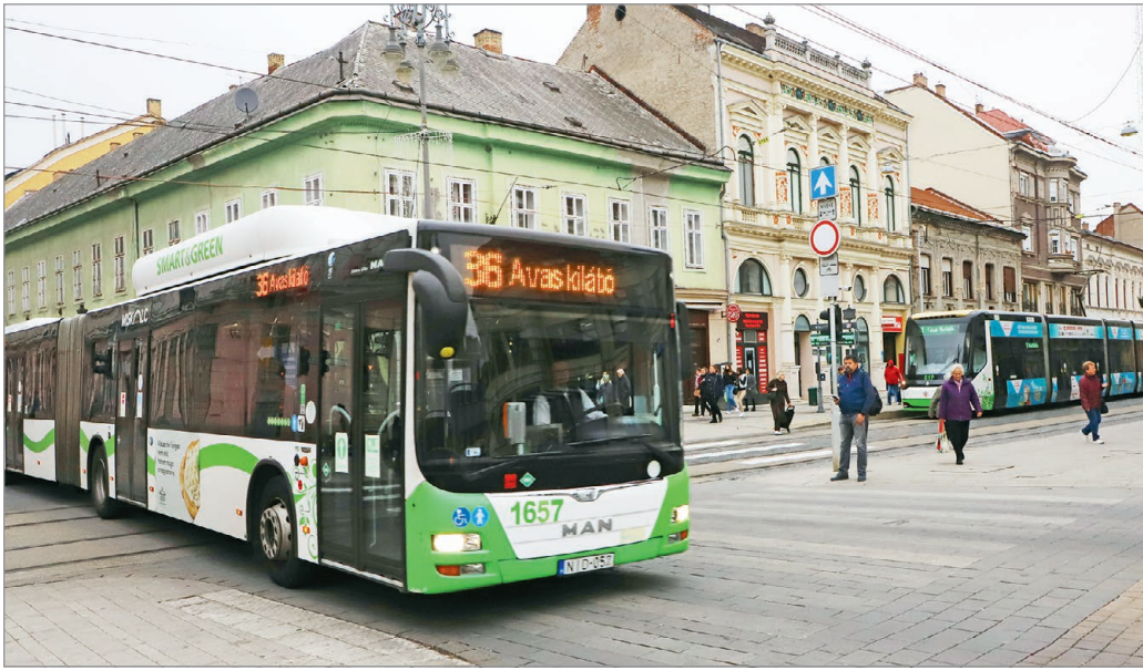
Múlt szombat óta sűrűbben jár a villamosok és a buszok jó része is.

– Úgy látjuk, hogy ez viszonylag jól is sikerült, az MVK dolgozói valóban mindent megtettek azért, hogy tartani lehessen az új menetrendet. Azt tapasztaltuk, hogy a jármű- és/vagy sofőrhiány miatt egy-egy járatkimaradás előfordult, de látjuk a törekvést is a közlekedési társaság részéről, hogy ezeket megpróbálják operatív módon pótolni. Sajnos, amikor ez nem sikerül, akkor már a vég-