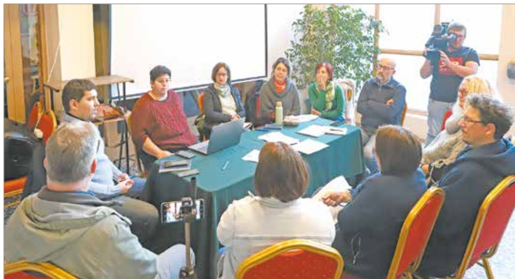
A pályázatnak hangsúlyos része volt a kulturális értékeink megőrzése.