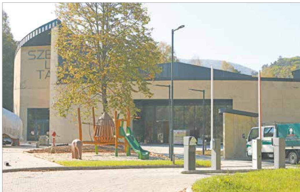
Már csaknem teljesen készen van a Szeleta Park.