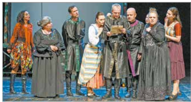
A beszélő köntös című zenés játékot is láthatja a miskolci közönség