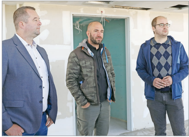
A presszóban már a gipszkartonozás is kész.