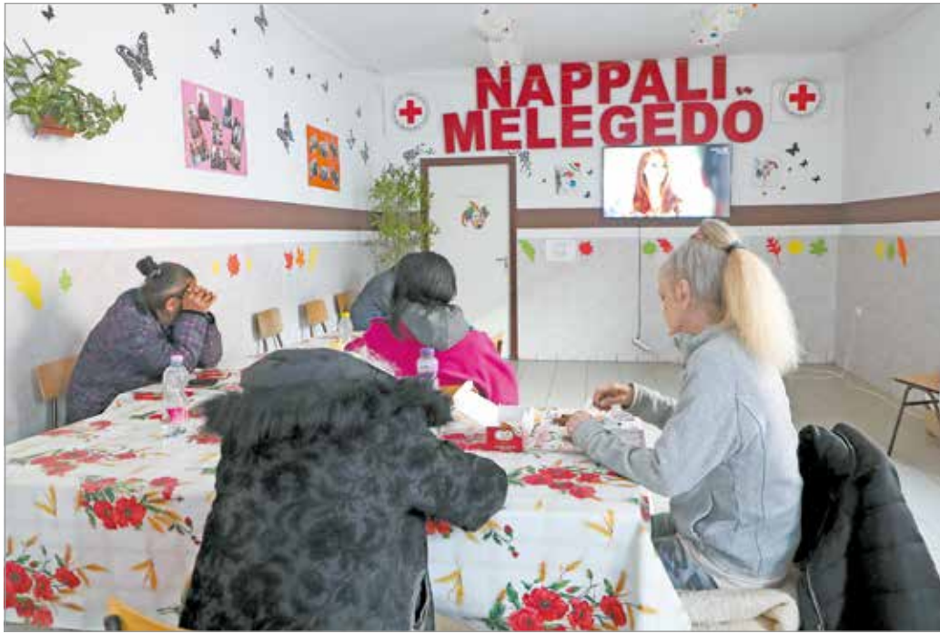
A melegedőben és a menedékhelyen pihenési, tisztálkodási, mosási lehetőség biztosított.