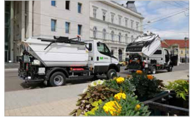
Kialakították a modern hulladékgazdálkodás alapjait.