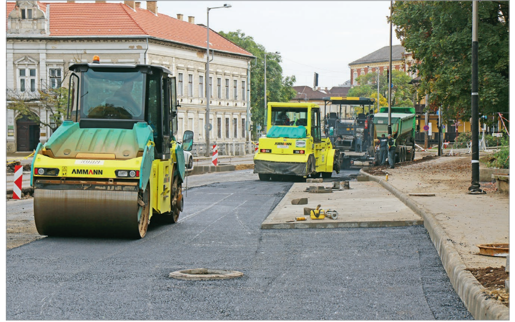
A Dayka-átkötés részeként a Kálvin János utca egy szakasza is megújul.

Folyamatosan halad a Dayka-átkötés kialakítása is, valamint a hozzá kapcsolódó utak, kereszteződések átépítése. Az új útszakasz nyomvonala már jól látható. A beruházás eredményeként a Dayka utca meghosz-