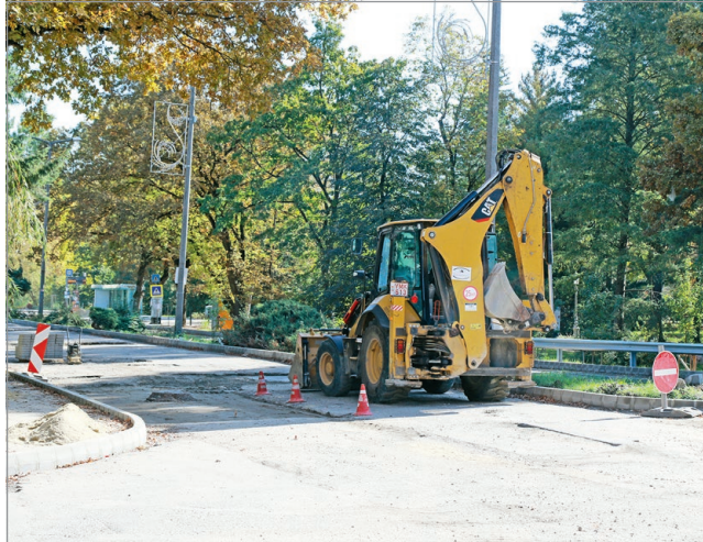
A Tapolcára kivezető főút mellett több kisebb utca is új burkolatot kap.