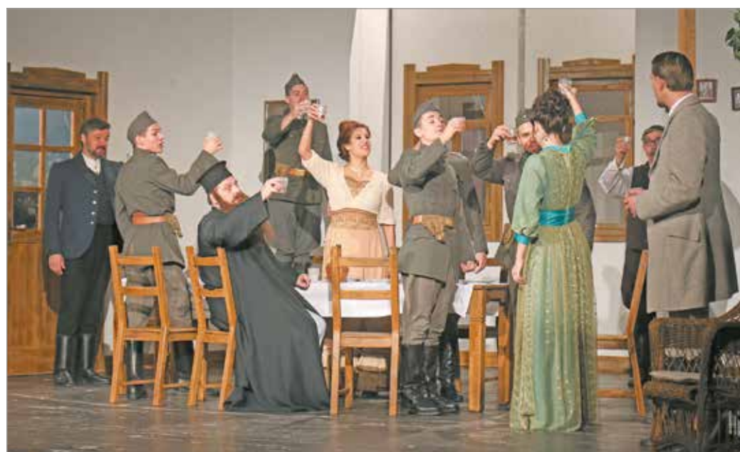
Hunyady Sándor 1930-ban írt drámája a miskolci előadás hatvan százalékát teszi ki.

– Hunyady Sándor a szabadkai Nemzeti Szálló éttermében látott egy szerb párt egy magyar főszolgabíró társaságában mulatozni. Észrevette azt,