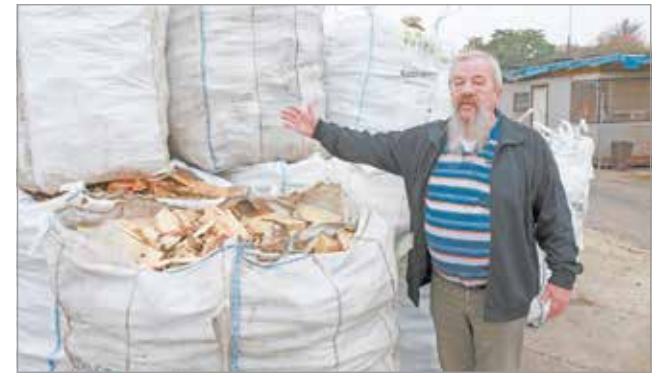
Már előkészítették a kiosztandó tűzifát.