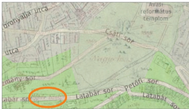
Hóhérbástya az Avason.