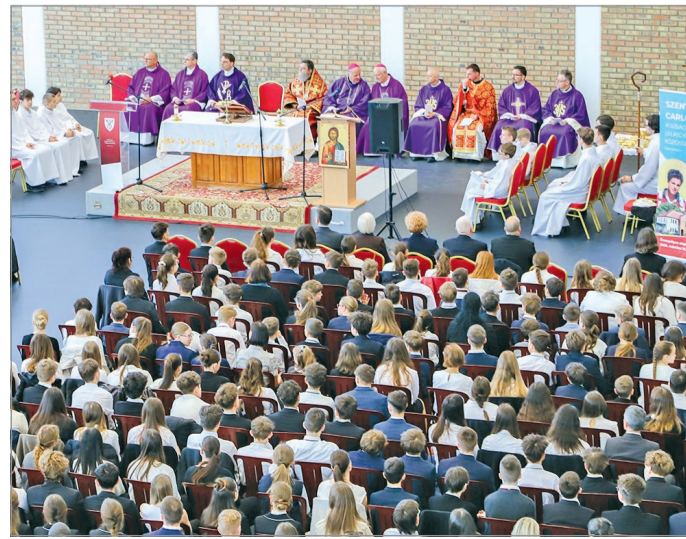
Szentmise előzte meg az alapkövetelést.

Egy tizenöt éves fiatalról kevésbé gondoljuk azt, hogy nyitott a transzcendensre, nyitott az Istenre. És van egy másik oka is a névválasztásnak, az, hogy ő jezsuita diák volt. A milánói jezsuita gimnáziumnak volt a diákja, így van egy nagyon fontos közös pontunk lelkiségileg ezzel a szenttel. Másfelől pedig úgy gondoljuk, hogy nagyon mély az ő sajátos üzenete. És másképp hangzik ez az üzenet egy tizenöt éves kortárs fiúnak a szájából, mint amikor mi, felnőttek beszélünk a diákoknak a hitről – fogalmazott az igazgató. BACSÓ ISTVÁN