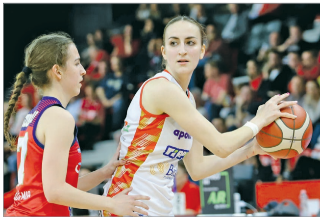
A negyeddöntőben a Vasas Akadémiát búcsúztatta a DVTK HunTherm.

– A bajnoki szünetre felkészülési mérkőzéseket szerveztünk, a Csata TKK ellen játszottunk két meccset, egyet náluk, egyet pedig náluk – mondta Völgyi Péter , a DVTK HunTherm vezetőedzője. – A mostani hetet pedig teljes egészében a Sopron Basket elleni meccsnek szenteltük, és mivel mindenki egészséges, mindenki motivált, így optimistán várjuk a párharcot. Furcsa volt az elmúlt három hét, hogy csak két edzőmeccsünk volt,