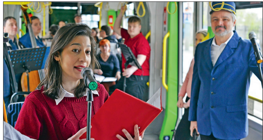
VERSVILLAMOS. Különleges program színesítette a miskolci villamosközlekedést április 10-én, pénteken. A hagyományteremtő céllal immár második alkalommal elindított Versvillamos a költészet napja alkalmából versekkel, zenével és jó hangulattal töltötte meg az utazást, mosolyt csalva az utasok arcára.

Hangsúlyozta, Miskolc nagy büszkesége volt mindig, hogy rendelkezik egy sportrepülőtérrel. A polgármester arról is szót ejtett, hogy terveik szerint augusztus 20-a környékén szeretnének újra repülónapot tartani az új helyen. D. A.