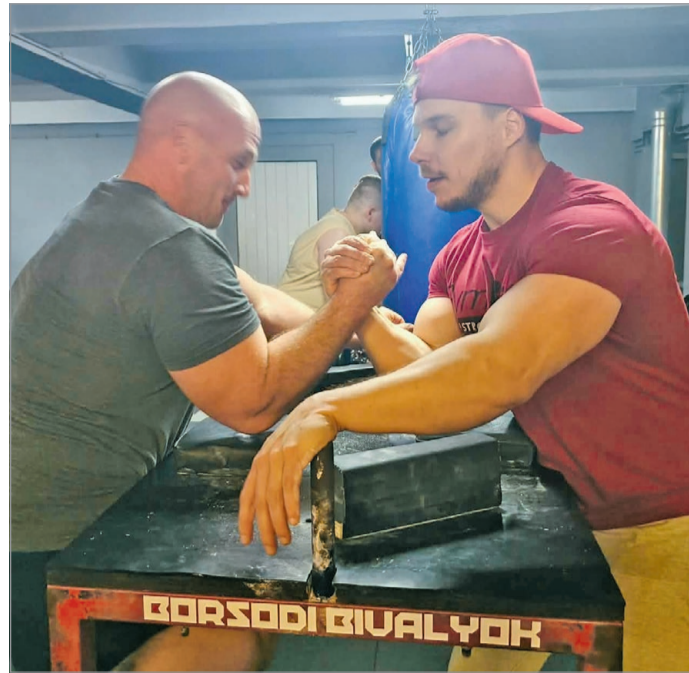
Edzés közben a Borsodi Bivalyok.

– Aki eléggé elhivatott. A szkander nagyon alulértékelt küzdősport. Az emberek nagy többsége nem is gondolja, milyen komplex sport a miénk. Nemcsak az erő, de a technika is számít. A toborzásra