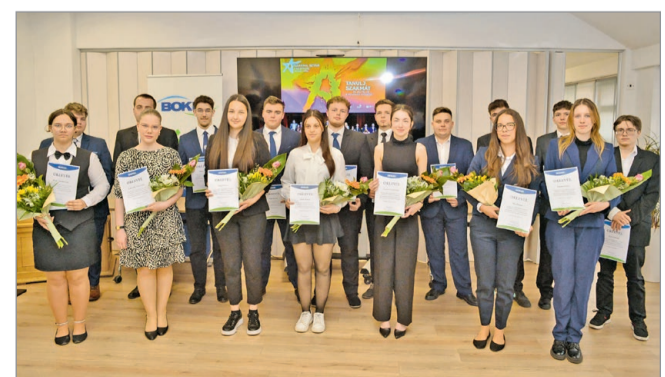
A szakmai versenyek eredményes szereplői.