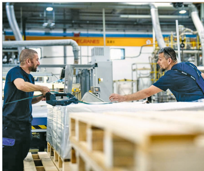
Hatékonyabb lesz a gyártás a cégnél.

Hozzátette, a vállalat teljesítménye nemcsak az ágazat, hanem a vármegye ipari eredményeihez is jelentősen hozzájárul, és saját kategóriájában Európa öt legnagyobb cége