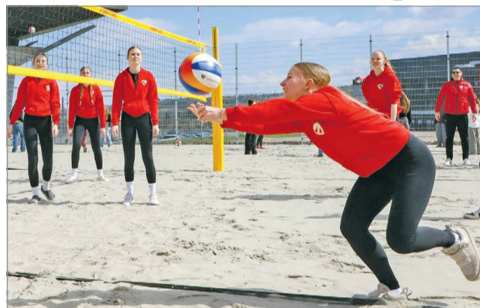
Ismét bővült a diósgyőri sportliget.

– A látványsportok komoly támogatást élveznek, hidat képeznek a testkultúra és a gazdaság között – folytatta. – Most az a feladatunk, hogy a