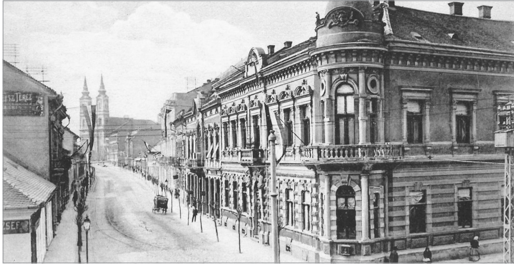
A miskolci ügyvédi kamara egykori székháza.

Bizony Ákos neve már az 1878-as nagy miskolci árvíz utáni újjáépítés idején is feltűnik a városi dokumentumokban. A városi építészeti bizottság tagjaként részt vett a helyreállítási munkákban, ami-