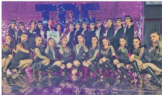
A Miskolcz-Revital TSE táncosai.