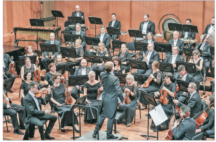
Izgalmas hangversenyek lesznek még a szezonban.

Május 7-én Maestro sorozatuk, s ezzel bérletes szezonjuk is népszerű programmal zárul.