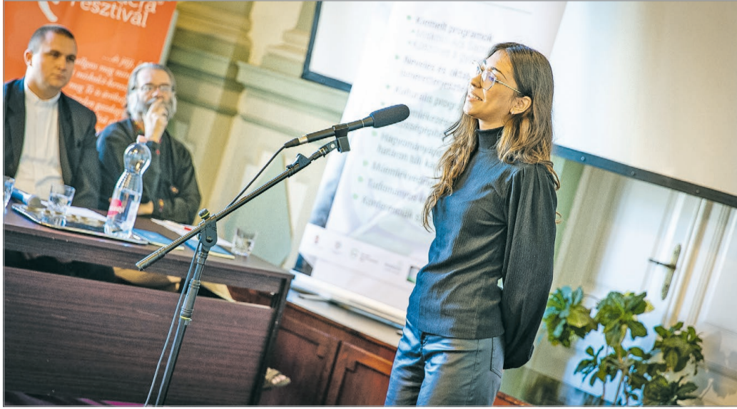
Tavaly is megrendezték a versmondó versenyt.

Az első három helyezett mindkét korcsoportban pénzjutalomban részesül, és minden induló kedvezményesen vehet részt a szervező Szent Genesius Versbarát Kör művészeti táborában június 29-től július 3-ig a Mindszenti plébánián. A döntőt szeptember harmadik hetében, a IV. Miskolci Ars Sacra