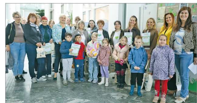
A díjazás után.

A miskolci önkormányzat ökomenedzser irodája által, a HungAIRy program keretében kiírt „Így komposztálunk mi az óvodában” pályázatra tizenkét óvodai csoport adott be különböző kreatívabbnál kreatívabb munkákat. A múlt hét keddi díjkiosztón minden lelkes csoport kapott ajándékokat és oklevelet, a legjobbakat pedig külön is díjazták a városvezetés. Az ökomenedzser iroda a Föld napjához kapcsolódóan hirdette meg ezt a programot.