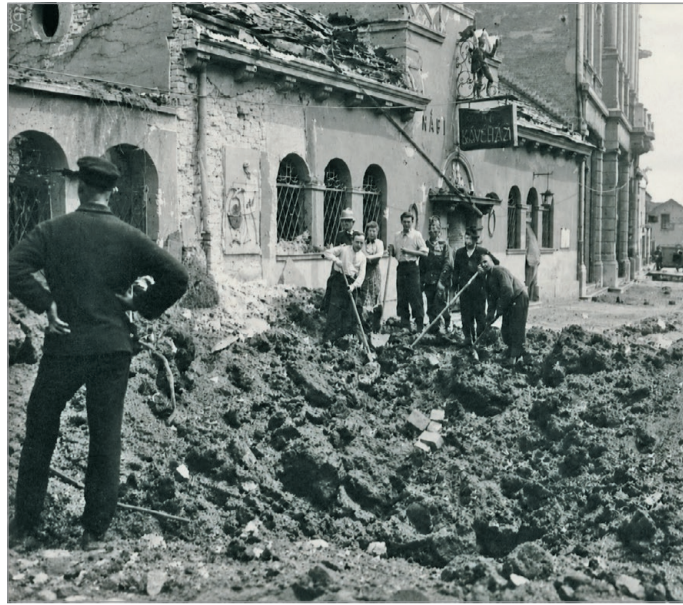
Romok a bombázás után.

Ám nem minden történet végződött szerencsésen. Egy apa már majdnem leért az óvóhely-