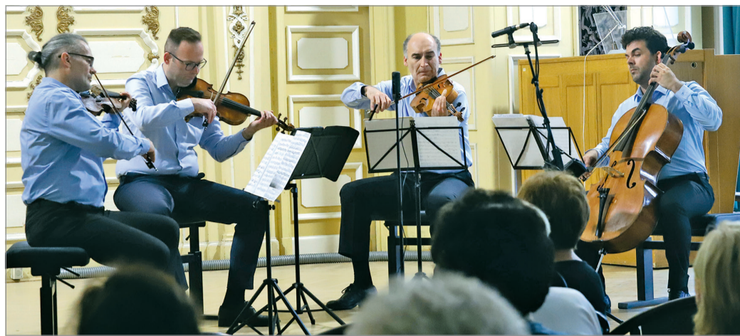
Az Anima Vonósnégyes.

– Nagyon sok minden történt ebben az időszakban, hiszen minden kezdő kvartett úgy indul, hogy rengeteg próbával várja a fellépési lehetőséget. Nekünk ez nagyon gyorsan megjött, gyakorlatilag egy hónappal az alakulás után már tudtunk játszani. Onnantól kezdve Miskolcon, mondhatni, állandóan a színen voltunk. Itt lehet olyan fellépési lehetőségekre gondolni, mint a Borso-di Zenei Fesztivál, ami annak idején futott, vagy a miskolci Operafesztivál, a Bartók Plusz, ahol gyakorlatilag kilenc vagy tíz alkalommal játszottunk sorozatban. Szerintem valószínűleg egyedülálló az Operafesztivál történetében, hogy mindegyikre meghívtak minket, és ott elég komoly sikereink voltak – mondta.