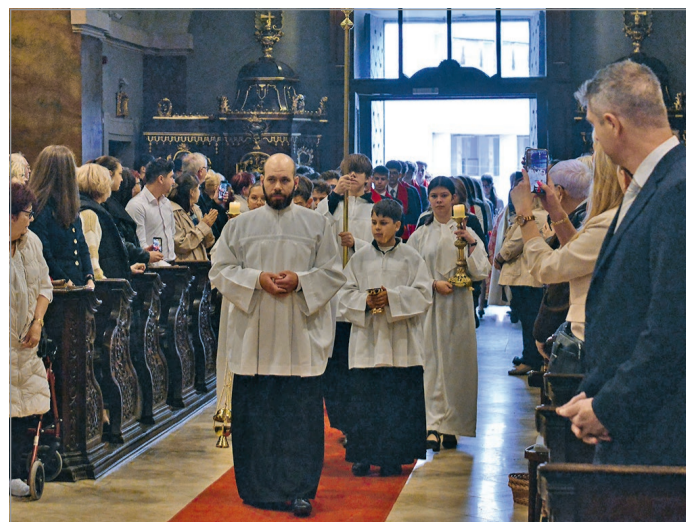
Bérmálási bevonulás a Mindszenti templomban.

Hozzátette, a bérmálás feltétele, hogy a gyerekek elérjék a 13 éves kort és rendszeresen járja-