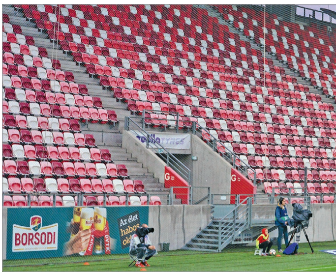
A stadion fő helye a DVTK legutolsó NB I-es meccsén.

A 2026. május 16-án megrendezett DVTK-Paksi FC (1-