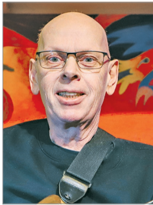
Fukk Attila.

Mindenki Fukija rendszer közreműködője a város kulturális rendezvényeinek. Emberi hozzáállása és szak-