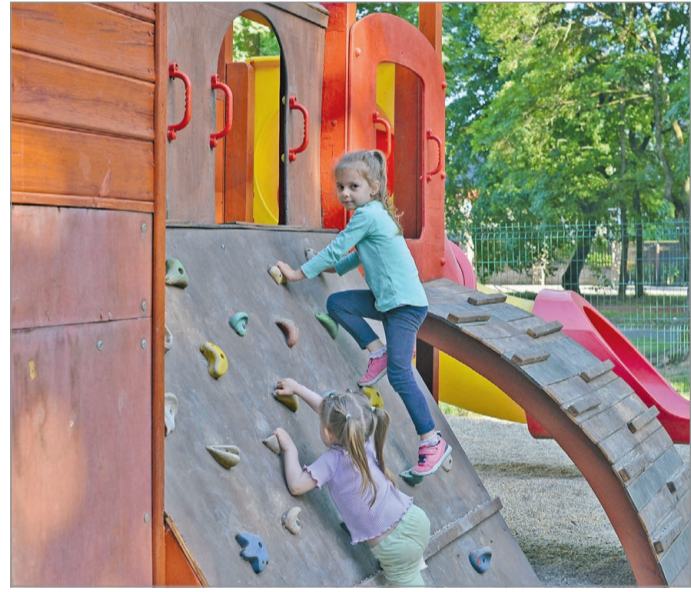
A népkerti játszótéren.