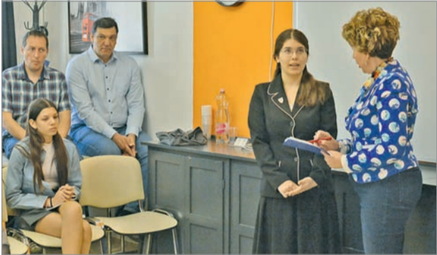
A szavalóverseny egyik pillanata.