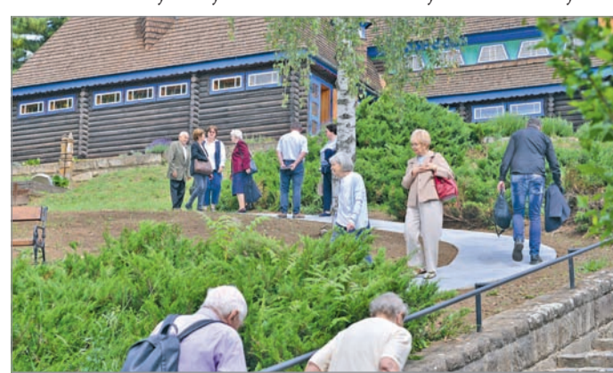
Az imasétányon.