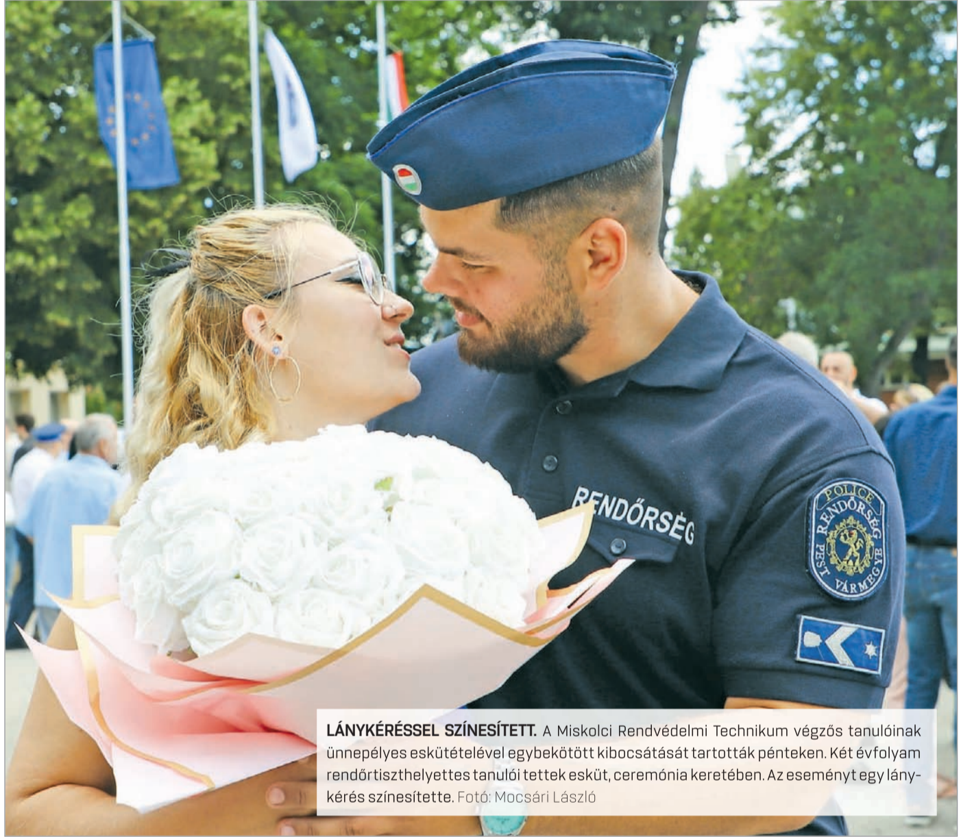
LÁNYKÉRÉSSEL SZÍNESÍTETT. A Miskolci Rendvédelmi Technikum végzős tanulóinak ünnepélyes eskütételével egybekötött kibocsátását tartották pénteken. Két évfolyam rendőrtiszthelyettes tanulóit tettek esküt, ceremónia keretében. Az eseményt egy lánykérés színesítette.