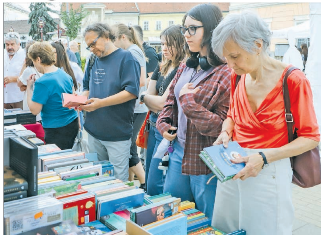
Könyvhét Miskolcon.

– Az irodalom, ha jó irodalom, számomra egyszerre ismerős és meghökkenítő tapasztalat. Olvasván az jut eszembe, hogy erre már én is gondoltam. És az is eszembe jut, hogy