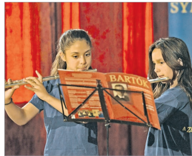
Évadzáró koncertet tartottak.