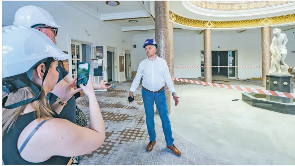
Akár már augusztusban megkezdődhet a próbaüzem a Barlangfürdőben.

– Jelen pillanatban azokat a munkaterületeket tudjuk megmutatni, amelyeken a kivitelezés december 1-je óta folyik. Ezek a fürdőcsarnok, a főépület és a barlangi járatok. Jelen kivitelezésnek nem szerződés-