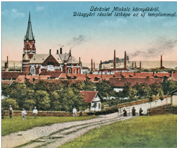
A vasgyári katolikus templom ábrázolása 1910 körül.

A diósgyőri vasgyár építése 1868-ban kezdődött meg. A gyár mellett kialakított munkástelepet – korabeli nevén gyarmatot – a Monarchia egyik mintatelepének tartották, ahol az egyazon architek-