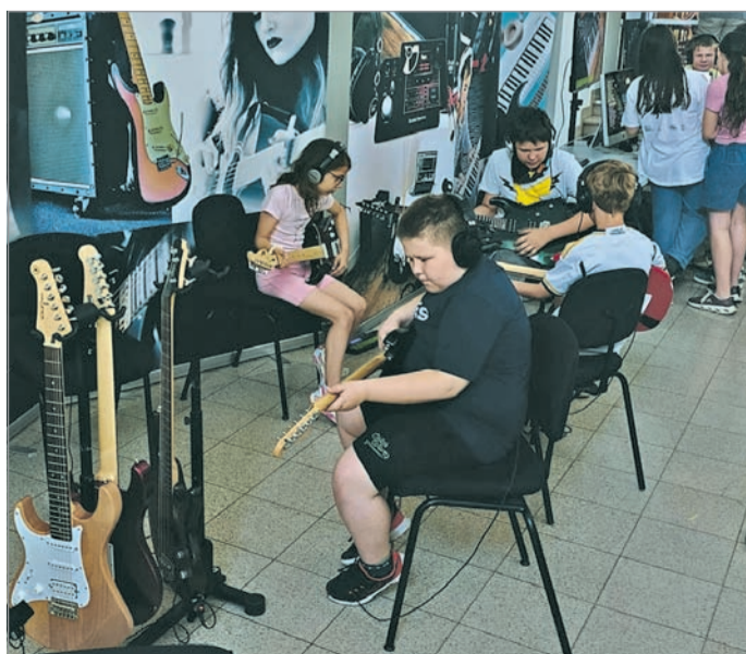
Kézben a hangszer.