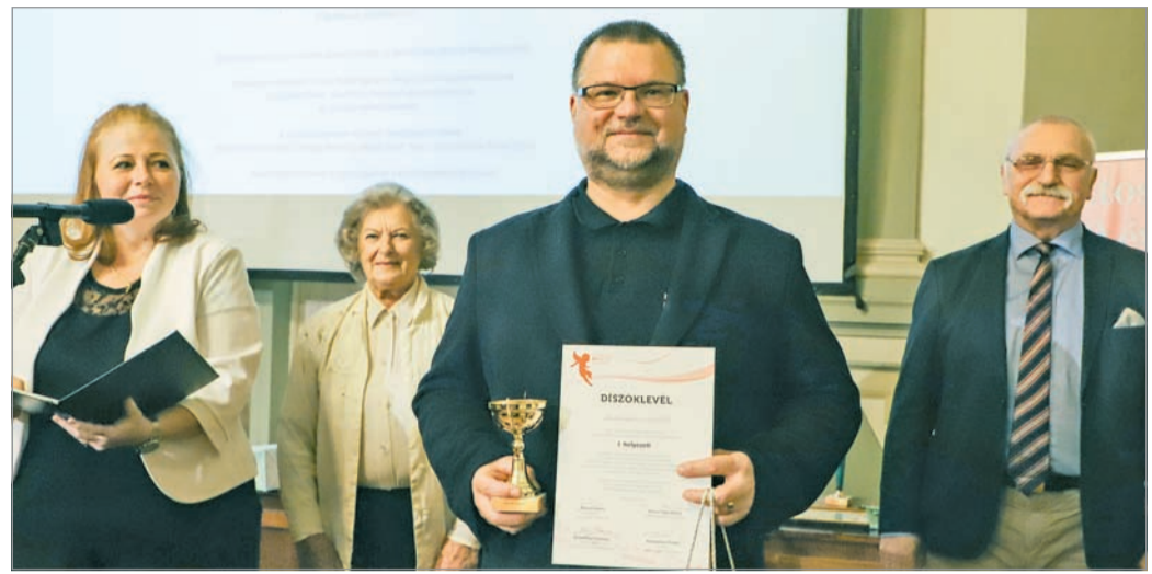
Az első helyezett elismerése.