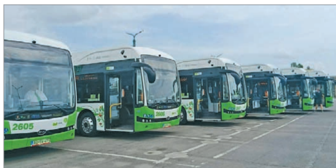
Hat új elektromos busszal bővült az MVK Zrt. flottája.

egyszerre megtenni Miskolc város útjait – ecsetelte, majd a jövőről beszélt: – Nem akarunk itt megállni. Két új busz még érkezik, és a lehető legtöbb elektromos buszt szeretnénk Miskolcon szolgálatba állítani. Ehhez szükségünk van a magyar kormány segítségére, EU-s forrásokra